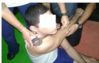
FIGURA 2 goniometria da flexão horizontal de ombro

Na FHO o indivíduo ficou em posição sentada com as pernas estendidas, mantendo uma postura reta, com a cabeça voltada para frente e ombros simétricos. O braço direito manteve-se abduzido em um ângulo de 90° com o tronco, o cotovelo estendido com a palma da mão voltada para baixo. Logo após, o goniômetro foi posicionado com o seu eixo central sobre o ponto acromial. Uma das hastes manteve-se fixa nas costas do aluno no sentido transversal, ao longo de uma linha traçada entre os pontos acromiais direito e esquerdo e a outra sustentada na face externa do braço, sobre a linha traçada entre os pontos acromial e radial. Após a adoção desse posicionamento, o avaliado executou a FHO com exigência máxima, como ilustra a figura 2.