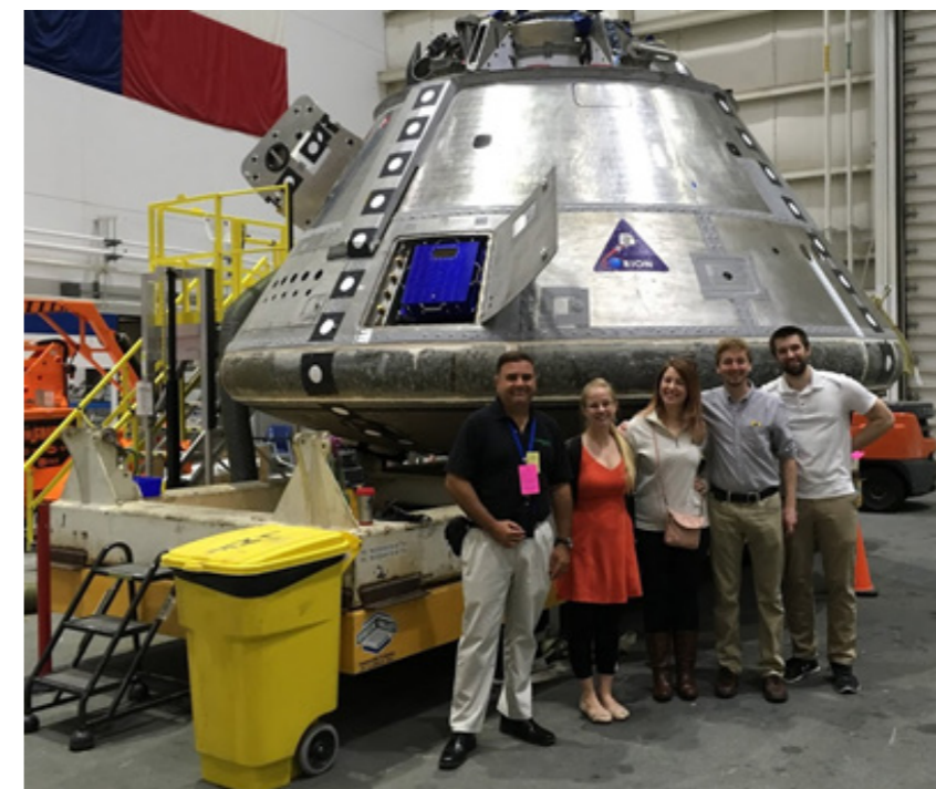
Cápsula Orión, Centro Espacial Johnson

SpaceX ha logrado desarrollar el vehículo comercial de lanzamiento de cargas al espacio número uno en rendimiento, costo y prestaciones, el Falcon 9. Este impresionante vehículo espacial ha logrado reducir el costo de lanzamiento múltiples veces, gracias a su tecnología de reutilización de las primeras etapas, que es donde se encuentra gran parte del costo del vehículo lanzador. En el caso del Falcon 9, llamado así por el número de motores cohete que tienen su primera etapa, ha posibilitado una reducción de precios tal que ha acabado con la competencia en vehículos lanzadores. En la actualidad, ni siquiera agencias espaciales como la de la India, China o Rusia pueden competir con los precios que ofrece esta empresa norteamericana, a pesar de las diferencias salariales que separan los unos y los otros. La clave del éxito de SpaceX ha sido la innovación que ha hecho posible la recuperación tanto de sus primeras etapas, tanto en el océano, como en plataformas