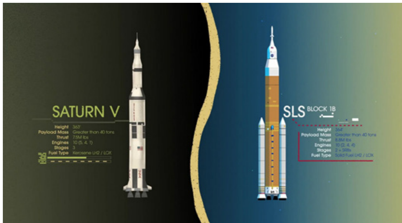
Cohetes Saturno V y SLS lado a lado.

ton. Estos grandes depósitos de agua, que fue transportada por asteroides, han permanecido durante millones de años dentro de cráteres que se encuentran en permanente oscuridad. Esta penumbra permanente ha permitido que el agua existente no se evaporara hacia el espacio.