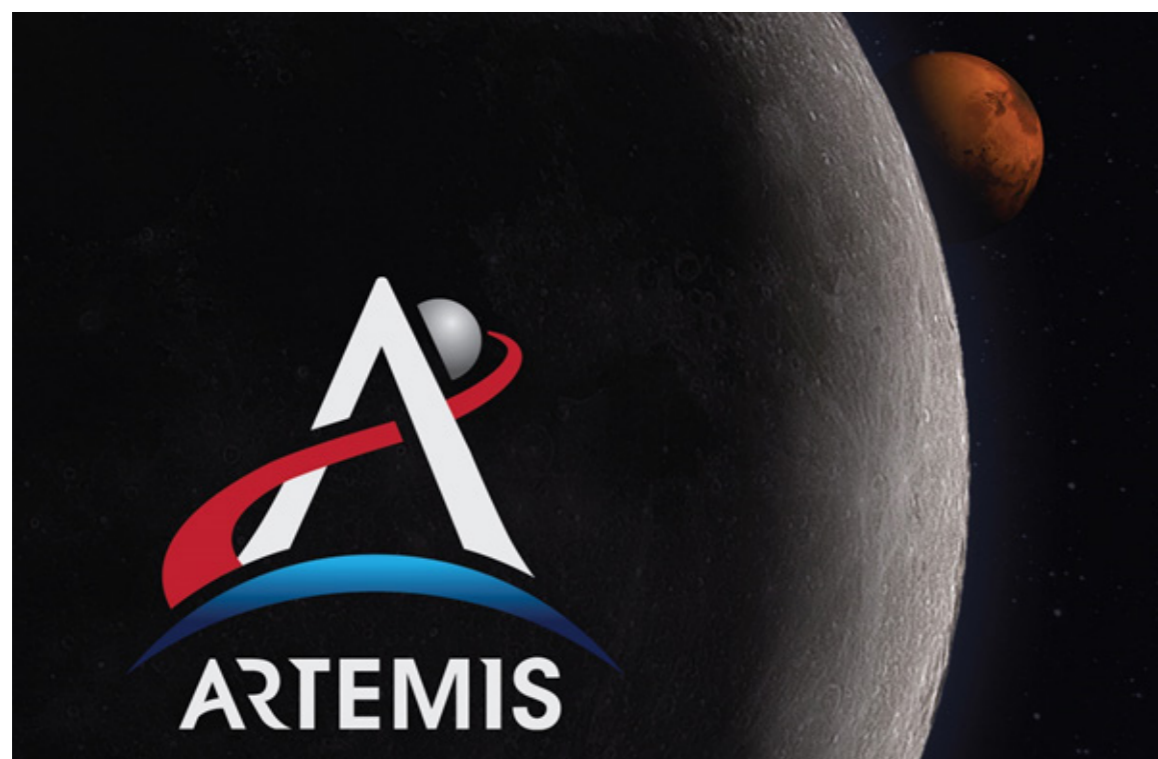
Logotipo del Programa Artemisa.

similar a uno de los módulos de la Estación Espacial Internacional, pero con el beneficio de estar conectado al PPE, con su sistema de propulsión que le permitirá estar en una órbita lunar de tipo polar casi-rectilínea. Para el descenso en la superficie de la luna, los astronautas utilizarán otro vehículo que estará acoplado en el Gateway y es llamado Human Landing System (HLS) el cual les permitirá descender suavemente en la superficie lunar de un modo similar al utilizado durante el programa Apolo. Tanto el SLS, como la cápsula Orión son desarrollados por la NASA, mientras que el Gateway y el HLS se encuentran en desarrollo por parte de empresas privadas que le brindarán este servicio a la NASA por el pago un canon determinado. En este momento, tres empresas norteamericanas compiten entre sí, para lograr el mejor, más seguro y más económico sistema de descenso lunar.