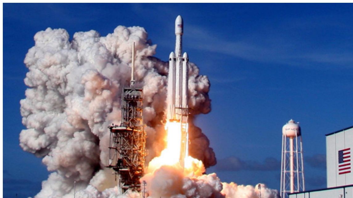
Cohete Falcon Heavy

prendimientos privados tales como la empresa Satellogic y otras iniciativas en donde se encuentran en desarrollo al menos dos programas de lanzadores de bajo costo, podemos asegurar que la industria espacial nacional continúa un desarrollo vigoroso. Si bien desde la década del 90, el programa espacial nacional se ha focalizado más en la observación terrestre, tampoco es necesario descuidar algunos de los grandes programas espaciales que están desarrollando otras naciones. En su momento, la República Argentina fue invitada a participar del programa de la Estación Espacial Internacional junto con Brasil. Lamentablemente en ese momento La Argentina declinó esta invitación. En esta nueva oportunidad, La NASA está buscando nuevos socios internacionales para formar parte del programa Artemisa y varios países ya se han sumado a esta iniciativa. Si bien las posibilidades económicas y técnicas de la Argentina no nos podrían colocar en posición de realizar una participación onerosa en términos económicos, la capacidad lograda en los últimos años en el desarrollo de sistemas espaciales complejos nos pone en una posición muy ventajosa para ofrecer determinados experimentos, propuestas de experimentos, desarrollo de