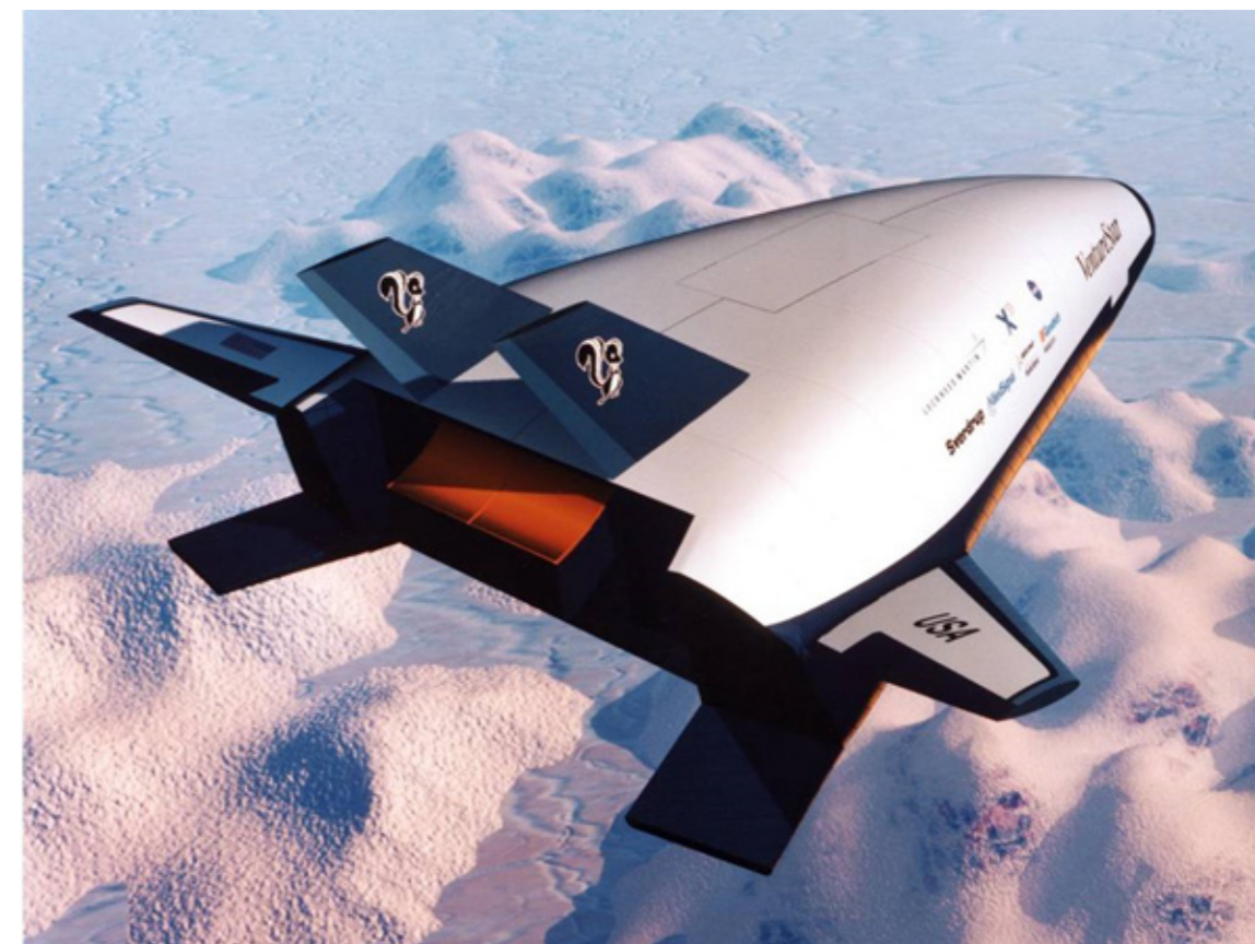
X-33 VentureStar.

las expectativas de reusabilidad y bajo costo que habían propuesto sus creadores. Después de algunos años con varios proyectos inconclusos, como el recordado X-33 VentureStar de la Lockheed-Martin y otros intentos igualmente fallidos, en el año 2017 se propone un nuevo programa de exploración lunar llamado Artemisa (Artemis). Lo inesperado de este anuncio de los Estados Unidos obedeció a dos elementos; el primero mantener el dominio de los Estados Unidos en el espacio (en particular en el campo de los vuelos espaciales tripulados) y segundo, la aplicación práctica de los avances tecnológicos realizados en las últimas décadas para la realización de misiones extendidas a nuestro satélite natural, que tengan como objetivo ya no puramente la exploración con intereses científicos, sino la explotación de los recursos naturales existentes en la luna. Este nuevo proyecto, llamado Artemisa en referencia a la hermana gemela de Apolo, tenía en un principio el objetivo de volver a poner pies en la luna antes del 2024. La razón específica de acelerar un programa, dando un relativamente breve lapso entre anuncio y ejecución, obedecía a una decisión política asociada con la administración anterior de los Estados Unidos, con lo cual es posible que este plazo para la primera misión de descenso lunar sea movido hasta 2026 al menos.