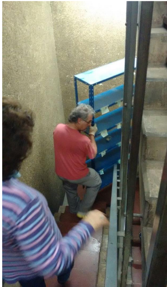
En el Espacio para la Memoria y los Derechos Humanos, exD2, bajando estanterías para armar el archivo.