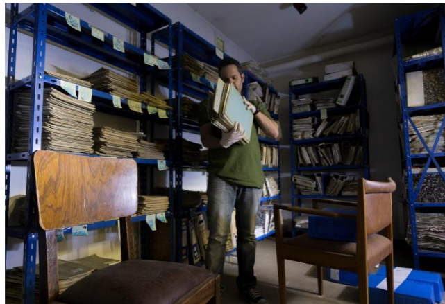
Preparando los legajos para su entrega

Ante todo lo dicho, quedó en evidencia que la Universidad Nacional de Cuyo, gracias a su estabilidad política y autonomía y sumado a la participación y el compromiso en temas de Derechos Humanos, se ha establecido como una institución confiable para la custodia de documentos tan sensibles y propensos a los ataques y vandalismo.