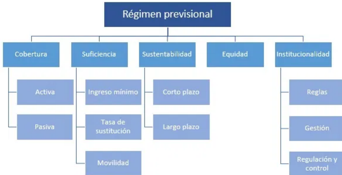
Figura 1. Objetivos de la previsión social.

6- La institucionalidad combina el diseño de las políticas públicas en el área previsional, la gestión a cargo de entidades públicas y privadas (recaudación de las cotizaciones, administración de los fondos y el cálculo y otorgamiento de las prestaciones) y la regulación y supervisión del funcionamiento de la previsión social en sus distintos ámbitos (Arenas de Mesa, 2020).