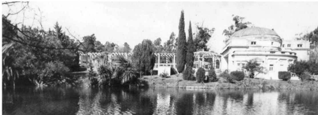
Fig.8. Imagen tomada desde el lago.

la atención del espectador sobre el espacio escénico.” (Iturria, Bruzzo, Oliva, Kuschich, 2016).