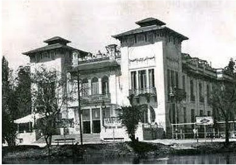
Fig.3. Teatro de verano (1915). | Fig.4. Islote en el Paseo del Bosque, Anfiteatro Martín Fierro (1949), vista aérea.