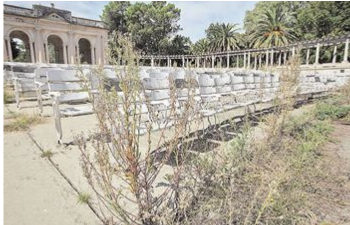
Fig.9. Imagen del estado de degradación reciente.

Además, rehabilitar representantes de un patrimonio asociado a la construcción histórico-social, persigue compatibilizar su uso original con las demandas de la nueva sociedad. Indagar en un referente del patrimonio reciente de la ciudad, como es el Anfiteatro Martín Fierro, permite iniciar una investigación en el ámbito del patrimonio público cultural desarrollado en ella, sentando las bases hacia una futura puesta en valor y los fundamentos que consoliden un marco conceptual aplicable a edificios considerados dentro del patrimonio sociocultural. Desde una mirada contemporánea, incorporando usos actuales, adaptándolo a las nuevas realidades y demandas de la ciudad sin perder su esencia, ni invalidar su uso original.