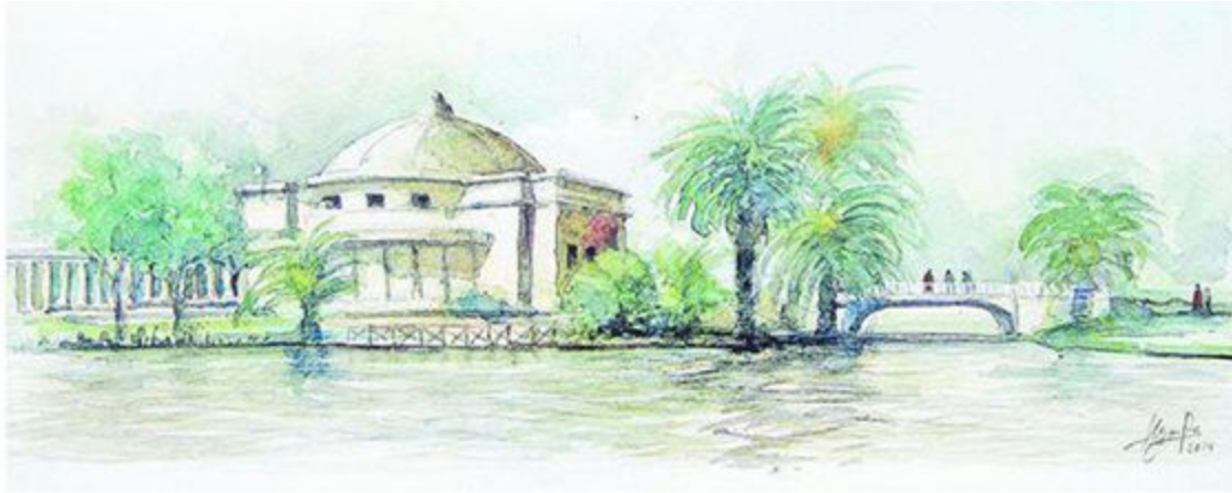
Fig.7. Anfiteatro inmerso en el entorno del bosque. Acuarela de Alejandro Pérez.