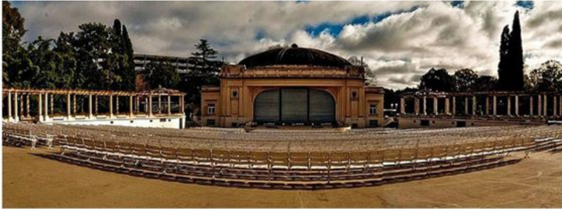
Fig.5. Imagen panorámica del Anfiteatro.

El vacío central es el propio anfiteatro al aire libre, con la distribución de las butacas en forma concéntrica hacia el escenario, la pendiente mínima correspondiente para la visibilidad, y una capacidad para 2.400 personas (Fig.5.). La pérgola funciona como palco, al no acompañar la pendiente del suelo y generar una diferencia de nivel.