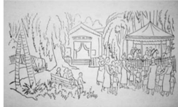
Fig.2. Primer teatro en el islote del bosque. Dibujo teatro del lago en "La Plata a su fundador" (1939) Edición de la municipalidad. Imagen extraída de "Planos históricos de obras privadas, patrimonio cultural del municipio de La Plata, LEMIT serie III, n°4".

mayormente teatro de títeres, constituida por un patio de butacas rodeado de una galería, con capacidad para 100 espectadores (Iturria, Bruzzo, Oliva, Kusch, 2016).