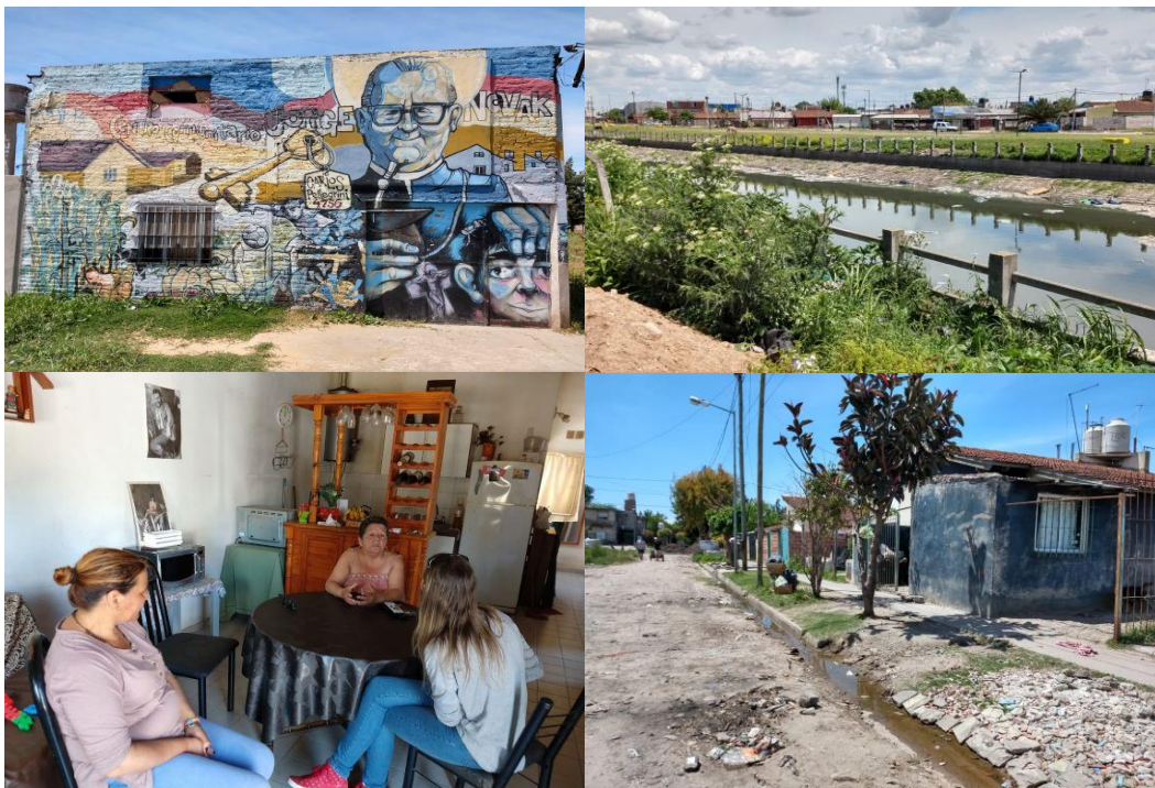
Barrio Novak: Merendero, Arroyo Las Piedras, entrevista con vecinas y calle.

Territorios pensados. Si bien Quilmes se ubica en la denominada segunda corona de la RMBA, tiene características particulares que lo aproximan al modelo urbano de la primera corona: una consolidación residencial más antigua en las ciudades de Quilmes y Bernal, con un consecuente crecimiento demográfico relativamente bajo en términos comparativos con municipios de segunda y tercera corona metropolitanas. Quilmes tiene una elevada densidad de población: 4664 Hab/km 2 ; sin embargo, al mismo tiempo, desde la década de 1980 la historia de los sectores populares de Quilmes está atravesada por las experiencias de tomas de tierras y formación de asentamientos. Ello es parte de un proceso de pauperización y deterioro de las condiciones de vida de los sectores populares, así como sus dificultades para acceder a la vivienda, dando lugar también a la transformación de modalidades de organización y lucha. Estas prácticas sociales tienden a distanciarse de las propias de instituciones tradicionales, poniendo en tensiones mediaciones político-sociales y revalorizando representaciones de cada sector. En este contexto, las organizaciones de lucha por la tierra y la vivienda constituyen el sector más movilizad y con niveles de articulación crecientes entre organizaciones de base en la toda la RMBA. Vale decir que hay dos Quilmes, uno de sectores de ingresos medios y altos, y otro de sectores populares con índices de NBI muy elevados