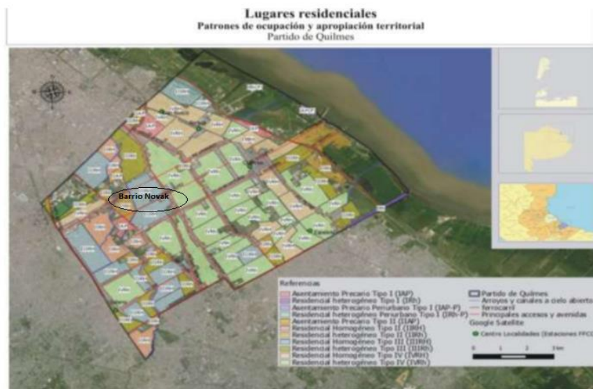
Lugares residenciales del Partido de Quilmes.

Una buena manera de interpretar los territorios pensados es mediante los resultados de la aplicación del Método Stlocus (Bozzano, H. y S.Resa, 2009). Gastón Cirio aplicó Stlocus a la totalidad del territorio de Quilmes, manzana por manzana. En su tesis doctoral el barrio Novak corresponde a Residencial Homogéneo de Tipo II: “En este marco, los niveles de apropiación del territorio son significativamente elevados, con una importante presencia de colectivos sociales organizados, con fuerte impacto en las prácticas locales.. (y con el tiempo) la tendencia a la consolidación de estos asentamientos, con la incorporación de obras de iluminación, asfalto y equipamientos colectivos sigue siendo, sin embargo, insuficiente para mejorar drásticamente las condiciones de vida de sus habitantes. (Cirio: 317: 2016)