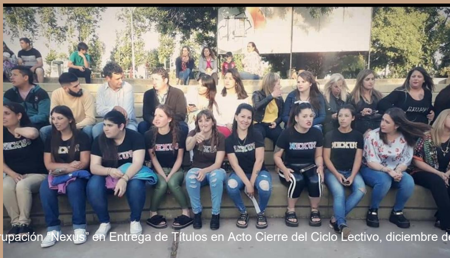
Foto: agrupación "Nexus" en Entrega de Títulos en Acto Cierre del Ciclo Lectivo, diciembre de 2018

Retomando el Acto en la Plaza Pública, la Jefa Distrital traduce sus palabras de la siguiente manera: “¿Qué significa esto? que la Dirección de Adultos ha reorganizado todas las propuestas en función de crecer y darle la oportunidad a los adultos mayores de 18 años de terminar con una multiplicidad de ofertas en estudios secundarios”. Y yo agregaría que, no solo es una oportunidad para las personas adultas que no tienen sus estudios terminados, sino que este desarrollo empodera a la comunidad en el ejercicio de sus derechos y fortalece al Plan como dispositivo para seguir pensándolo, ya no como alternativa, sino como opción para que personas que no pueden cursar todos los días, como ofrece el sistema tradicional, puedan continuar con sus vidas sin atravesar la frustración de abandonar el ejercicio de sus derechos a la educación pública, laica y gratuita. También, se puede observar sobre los sentidos que a otros actores interpela que existan Sedes del Plan en Rauch, porque dependen del mismo para el quehacer en sus vidas (docentes, personal no docentes, centros comunitarios, entre otrxs).