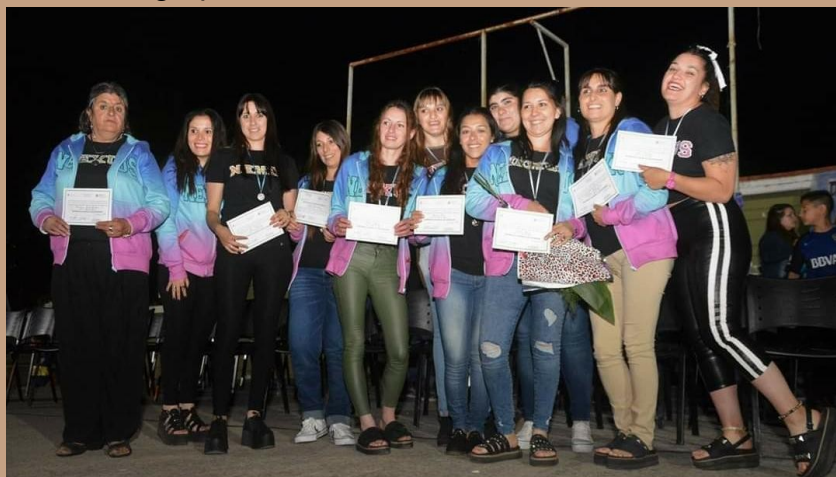
Foto de grupo de egresadas promoción 2018, en el Anfiteatro Municipal.

El proceso de aprendizajes, enseñanzas y de nuevas amistades, se da porque las personas se comunican para hacer algo en común y en beneficio a sus ideas. También existen conflictos, peleas, rencores, discusiones en general, las cuales muchas veces somos lxs docentes quienes mediamos las formas de comunicación para acompañar de manera menos traumática ideas que no se pueden llevar a cabo o conflictos grupales que generan las diferencias entre los grupos.