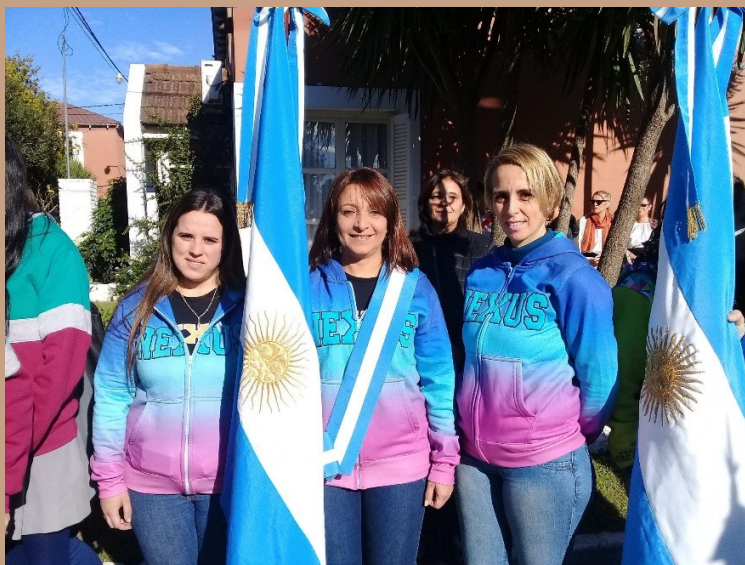
Foto: abanderada, escoltas y docente del Plan FinEs 2, participando de Actos Patrios.