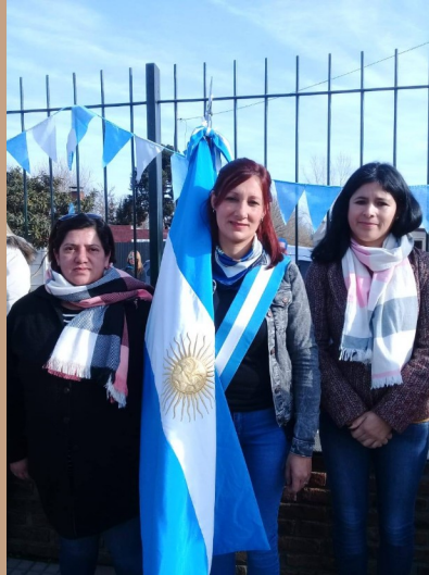
Fotos: Abanderadas, escoltas y docente presentes participando en Actos Patrios

Como investigadora, quería llegar a ese lugar íntimo que había ocurrido en el pasado, donde tomaron la decisión de abandonar los estudios secundarios, para conocer sobre sus experiencias previas y causa de toma de decisiones.