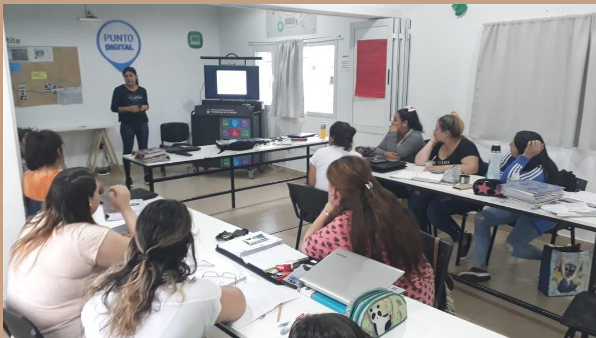
Foto de año 2018, Sede del Plan FinEs 2 en NIDO