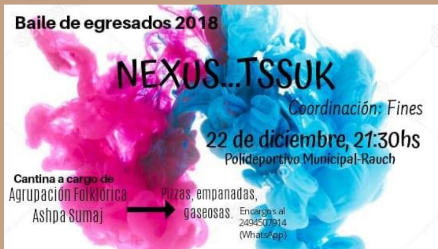
Tarjeta Invitación Baile de Egresados

por estudiantes del sistema educativo formal. De esta actividad participaron el resto de las comisiones y con ayuda de docentes y la comunidad, se realizó el protocolo de Baile de Egresados en un ambiente de celebraciones y fiesta.