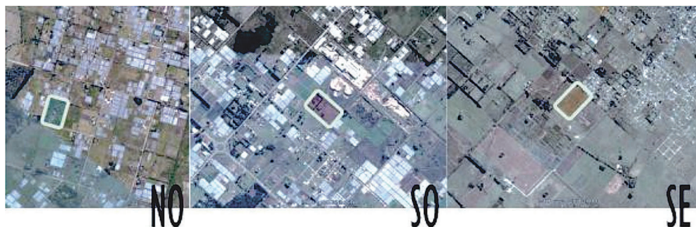
Cuadro 2 – Matriz de análisis: resultados Caso 1