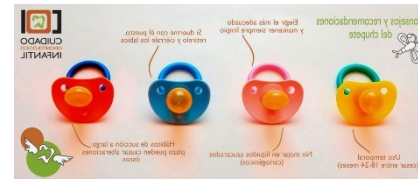
Folleto informativo sobre chupetes

Materiales y métodos: la Universidad a través de las diferentes acciones reafirma su alto compromiso por el trabajo sociocomunitario sintiendo la necesidad de fortalecer la salud de la población. Desde los integrantes de la Asignatura Odontología Integral Niños B, realizamos un abordaje voluntario priorizando fundamentalmente la salud integral de las madres gestantes y sus bebés, realizando videos educativos e informativos, flyers para otorgar a cada institución, folletos, vídeos y/o tutoriales ,reforzando la importancia del amamantamiento materno, sus beneficios tanto para el desarrollo de los músculos bucales y periorales como para el crecimiento de ese bebe en salud y prácticas sobre modelos similares a las bocas de los bebés como así también, los diferentes tipos de chupetes, mamaderas, tetinas para determinar cuál es la opción correcta de su utilización