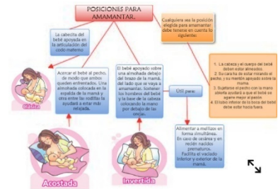
Folleto informativo sobre técnicas de amamantamiento