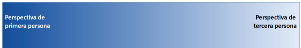
Figura 2. La perspectiva afectiva de los recuerdos personales.

en una distorsión del sentido del tiempo: el evento traumático parece estar sucediendo en el presente en lugar de ser percibido como habiendo acontecido en el pasado (Brewin y Holmes, 2003). De hecho, las personas que sufren de TEPT no solo han reportado que sus imágenes retrospectivas parecen reales, sino que a veces también responden como si el evento traumático estuviera sucediendo nuevamente: muestran signos de terror, síntomas autonómicos, como sudoración, e incluso reactualizan algún comportamiento, como por ejemplo agacharse como para evitar un golpe (Holmes y Mathews, 2010). Mientras que algunas teorías del TEPT consideran que la causa de la reviviscencia de los recuerdos traumáticos asociados se debe a su baja distinción cognitivo-emocional, es decir, al poco grado en que las emociones asociadas a un evento se separan de la representación descriptiva del evento (Boals, Rubin y Klein, 2008; Boals y Rubin, 2011), la teoría de la representación dual considera que las imágenes mentales visuales que caracterizan al TEPT pueden ser responsables de la reviviscencia. Las imágenes mentales pueden transmitir erróneamente una sensación de experiencia perceptiva inmediata que hace que el individuo las procese de manera momentánea no solo como reales sino como una amenaza real (Brewin y Holmes, 2003; Holmes y Matthews, 2010).