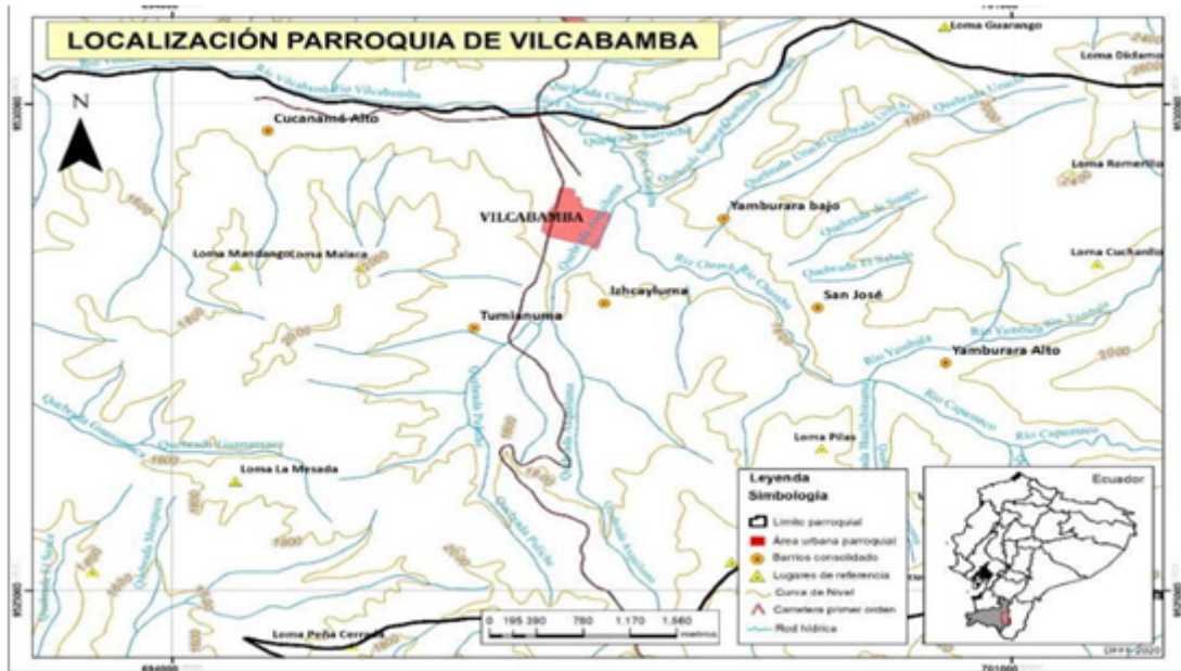
FIGURA 2 Área de estudio