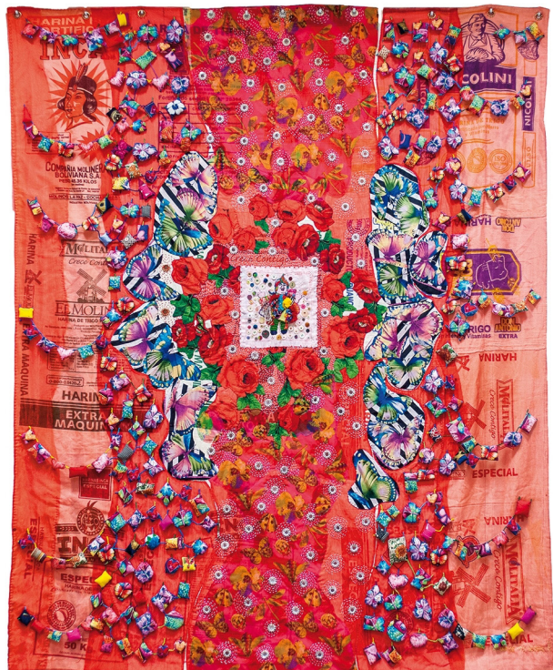
[Figura 1. Blanca Machuca, Altar de los deseos (2013). Extraída de la página del Museo de Bellas Artes de Salta: www.mbas.culturasalta.gov.ar ]

En el caso de Blanca Machuca, por ejemplo, la artista desplazó en sus obras la función netamente estética del arte a partir de la producción de objetos que evocan una práctica religiosa-ritual. Este pasaje lo inició con la elaboración de Exvotos y luego exploró sobre Altares, Protectores de Almas y otros elementos que formaron parte de las creencias populares y tradiciones campesinas heredadas de sus padres (van Gelderen y Santarone, 1997). En todas sus obras los materiales y procedimientos varían y la técnica siempre es mixta. De este modo, tiene obras en madera, papel y tejidos pero su soporte generalmente es la pared.