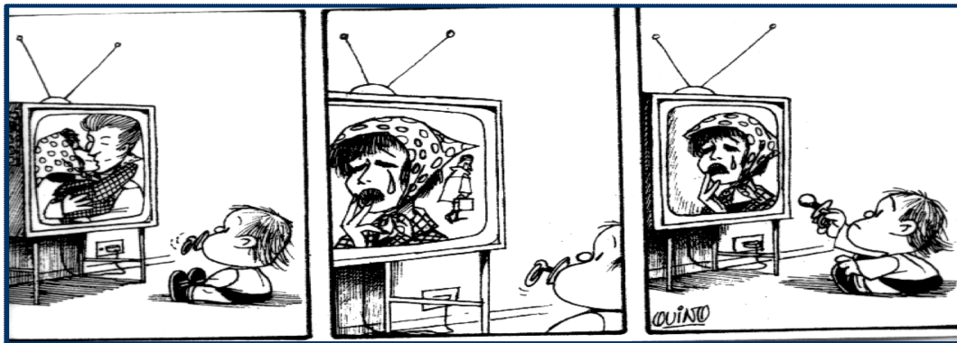
Imagen1. ‘Mafalda’ (Quino, 2011, p. 338)

Procedimiento. La tarea propuesta se iniciaba mostrando la siguiente secuencia de viñetas extraídas de la historieta ‘Mafalda’ (Quino, 2011; p. 388).