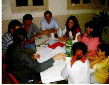
Taller Barrial: Grupo Bº Procasas, Bº FONAVI, Bº 15 de Septiembre y Zona Pantanosos

Acciones orientadas a fomentar el arraigo al campo, mejorando la calidad de vida rural y a consolidar un tejido social más inclusivo y solidario, en el marco de una gestión ambientalmente sustentable y participativa, donde el estado asuma un rol protagónico en la promoción del desarrollo local, sobre parámetros de calidad total.