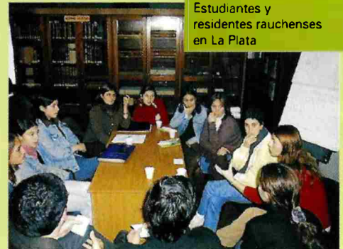
Estudiantes y residentes rauchenses en La Plata

Además se desarrolló en La Plata un Taller con Estudiantes y Residentes Rauchenses de la Capital de la provincia y su región. Para cada uno de estos talleres se constituyó una Comisión de Seguimiento que sobre documentos de base elaborados por la DAM-UNLP redactaron el Diagnóstico y las primeras Ideas Fuerza, como punto de partida para la Formulación del Plan.