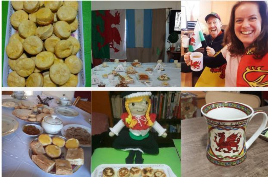
Gráfico 11: El té galés desde casa: Imágenes compartidas por interactores

Las capillas trasladaron sus cultos de canto a la pantalla de un Zoom. De esta manera, para muchos fue posible disfrutar del servicio religioso en galés y castellano desde la casa, y poder compartir en familia la tradición del té mientras escuchaban atentos a los himnos. Las comunidades galesas de las diversas localidades de la provincia, las familias, las instituciones y los grupos de canto, danza y recitación, compartieron esta singular forma de conmemorar el Gŵyl y Glaniad desde lo virtual, a través de las redes sociales, conformando ellos mismos una atmósfera conmemorativa particular, y gramaticalmente distinta, acorde al contexto sanitario vigente.