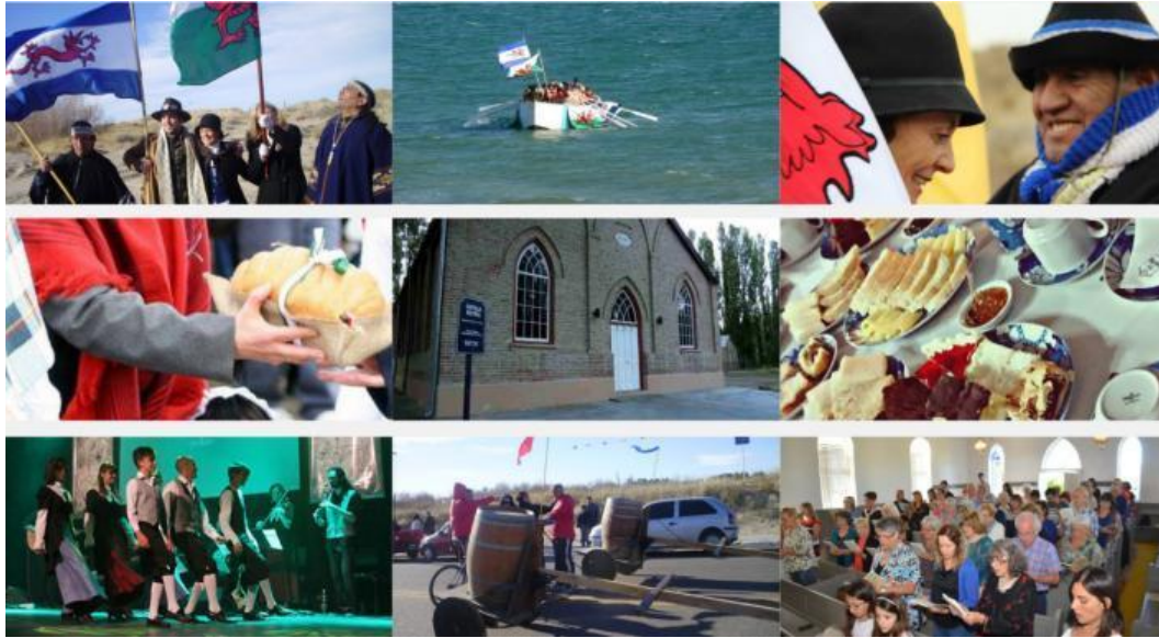
Gráfico 2 Actuaciones y escenificaciones durante el Gŵyl y Ganiad.

Luego de los ritos conmemorativos que se desarrollan por la mañana en Puerto Madryn, tiene lugar una de las representaciones más cabales, difundidas y popularizadas de la comunidad galesa en la provincia: el té gales, que se lleva a cabo en todas las localidades, pero que tiene su mayor concentración en el valle, en la pequeña localidad Gaiman, un lugar cuya raíz galesa es decididamente fuerte, además de contar con una extensa y variada oferta de casas de té.