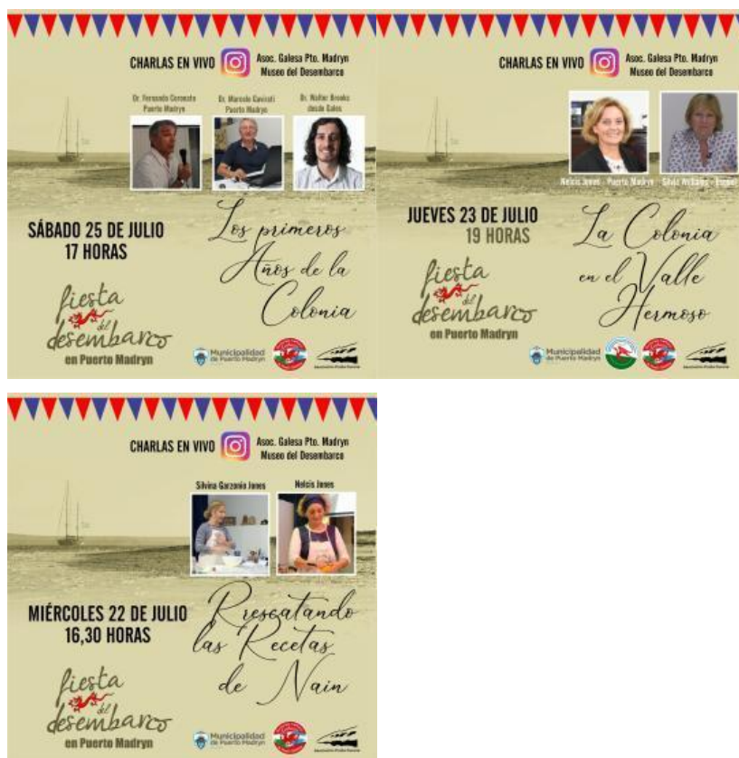
Gráfico 7. Charlas brindadas por la Asociación Galesa de Puerto Madryn durante el mes de Julio.

Por su parte, la Asociación Galesa de Puerto Madryn, donde anualmente se llevan adelante los actos oficiales vinculados a la recreación del desembarco, y de las olimpiadas que compartieron galeses y tehuelches, propuso también actividades de participación, encuentro e involucramiento en línea. Jugó entre las plataformas Facebook e Instagram, en conjunto con el Museo del Desembarco, para que los seguidores pudieran acceder a charlas sobre temáticas diversas vinculadas a la comunidad galesa: historia, repostería, geografía y toponimias, cultura, identidad, entre otras.