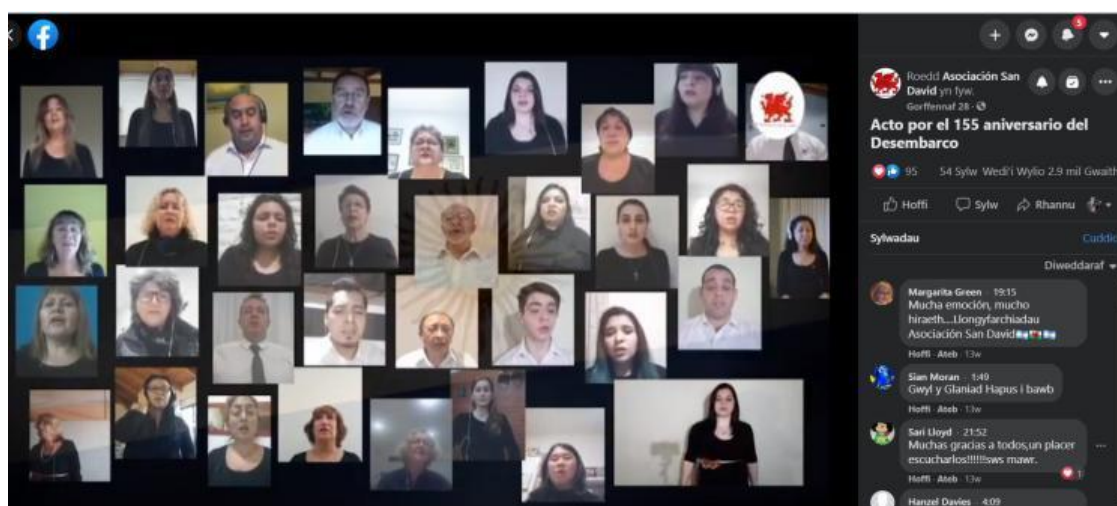
Gráfico 4: Intercacciones, reacciones y comentarios durante el acto central del Gŵyl y Glaniad.

La atmósfera se vuelve cuerpo, y se funde entre mensajes y reacciones: “Mucha emoción, mucho hiraeth...Llongyfarchaidau!”. Los mensajes, más allá de quienes dominan o no el idioma galés, se mezclan entre la emoción, la nostalgia, la herencia y el orgullo. Las más de diez mil visualizaciones que tuvo el acto central, permitieron metabolizar una atmósfera densa, cargada de galesidad y alegría en el encuentro.