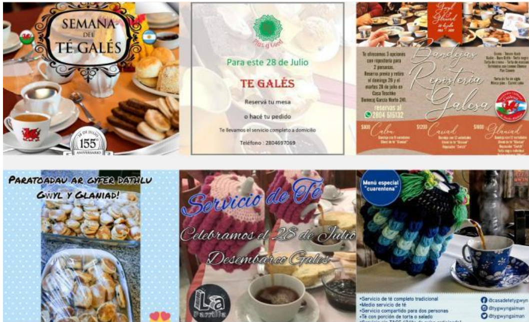
Gráfico 10. Servicios de té galés en modalidad delivery y take away

de vecinos y vecinas de disfrutar del té galés tradicional, tanto desde sus casas, como desde restaurantes y comercios gastronómicos.