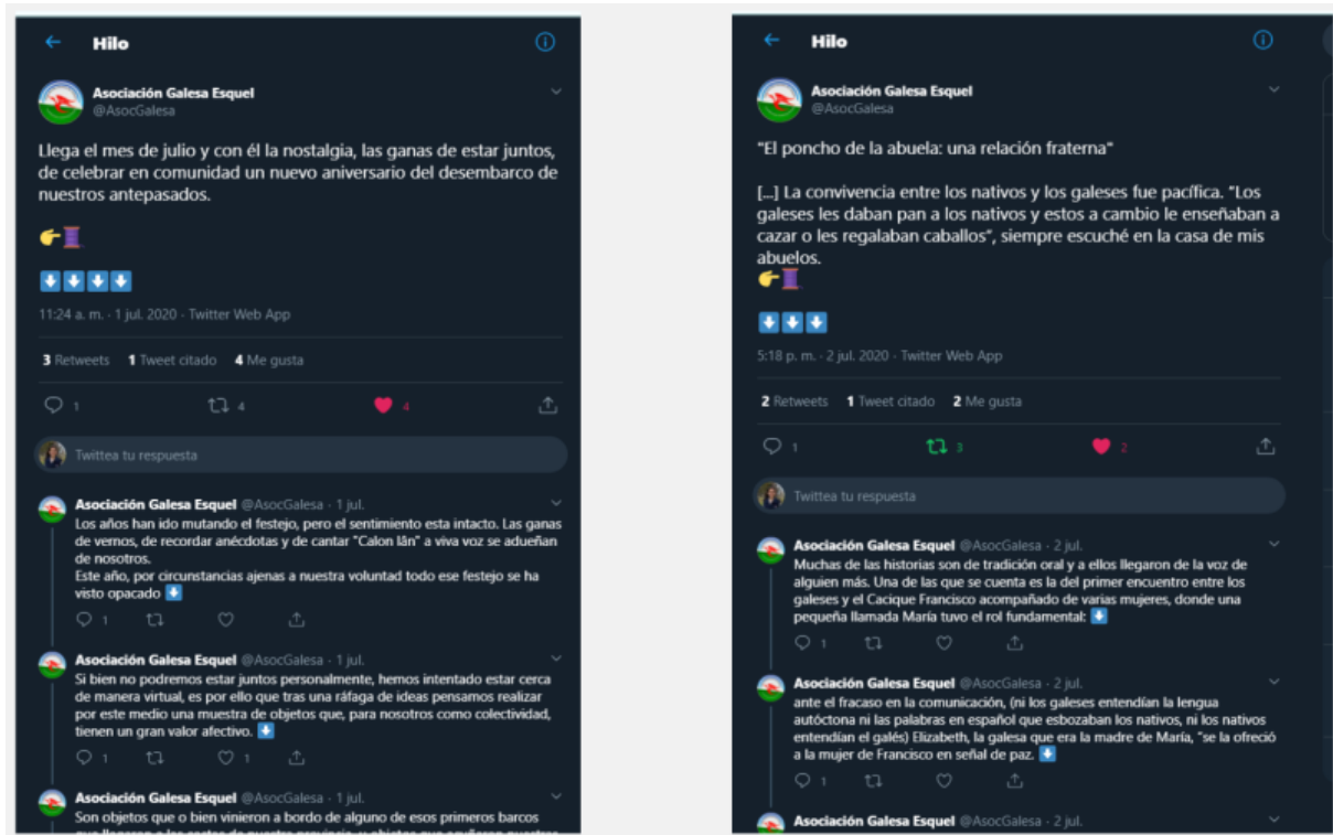
Gráfico 9. Hilos de la Asociación Galesa de Esquel.

brevedad en los textos, y de mayor visualidad, mediante su combinación con diferentes archivos e imágenes.