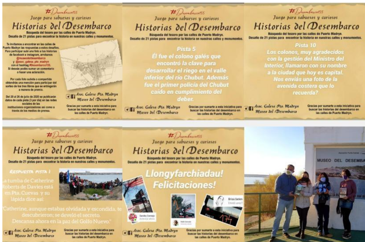
Gráfico 8: Navegación territorial: Desafío de pistas "Historias del Desembarco"

dedicado a descubrir marcas y huellas galesas diseminadas por la ciudad, mediante pequeños textos diarios que sugerían indicaciones y lugares. El juego completo "Historias del Desembarco", se compuso por 21 pistas diseminadas por la localidad costera. Al completarlas y documentar cada una de ellas, los ganadores accedían a un premio otorgado por la Asociación Galesa de Puerto Madryn y por el Museo del Desembarco. La estrategia, aquí desplegada, instaba a descubrir la ciudad en clave galesa: "búsqueda del tesoro por las calles de Puerto Madryn. Desafío de 21 pistas para encontrar la historia en nuestras calles y monumentos", como rezaba su tagline.