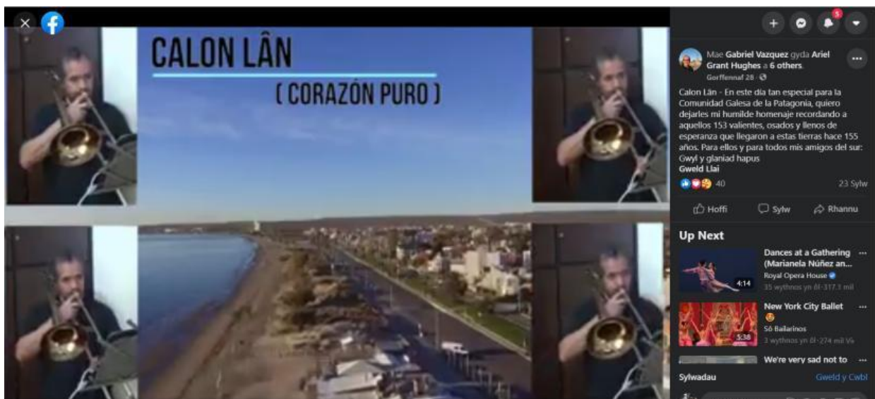
Gráfico 5. Interpretaciones, contenidos generados por los usuarios y participación: claves de la conmemoración del Gŵyl y Glaniad en el ecosistema digital

La Asociación San David de la ciudad de Trelew, apeló a la colaboración de la comunidad en el envío de saluciones de diversos actores, y manifestaciones tradicionales variadas, como canto, poesía, danza, y recitación en formato de video corto. Durante el mes de Julio, desplegó una oferta de materiales en variados formatos y soportes, nacidos de la interacción y el involucramiento de seguidores y comunidad general en el terreno de sus redes y perfiles digitales.