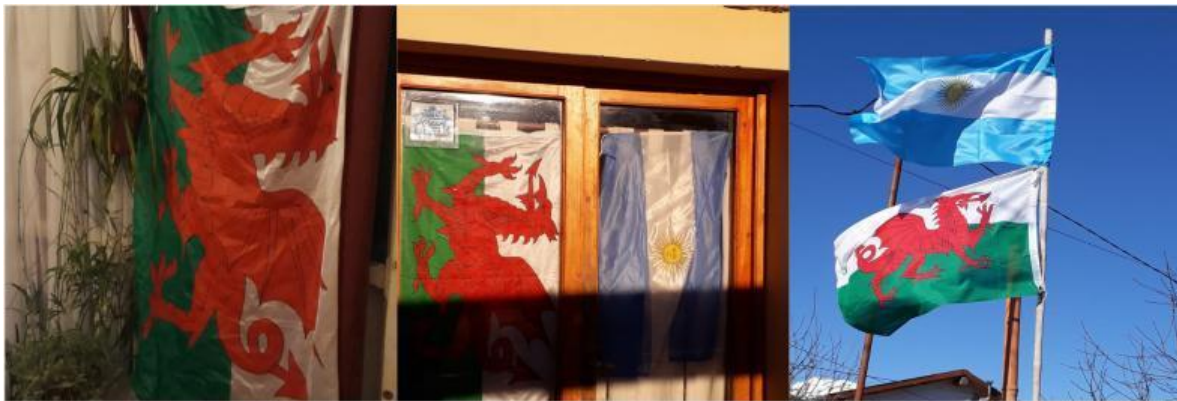
Gráfico 6. Embanderado de casas y espacios públicos durante el Gŵyl y Glaniad 2020

Durante todo el mes de Julio, compartió en sus redes sociales, los distintos saludos de personas, familias, clubes, asociaciones y personalidades destacadas de la zona, el país, y la nación de Gales en formato de collage audiovisual. Los seguidores y público general, reconociéndose en los videos, pudieron compartir su participación dentro de las celebraciones, lo que animó a que distintos comentarios enfatizaran el carácter comunitario de la propuesta.