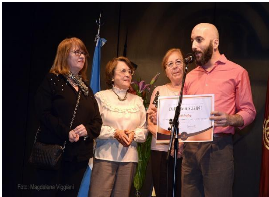
Entrega de Premio Susini