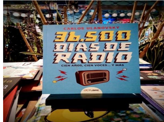
Libro "36.500 Días de Radio"