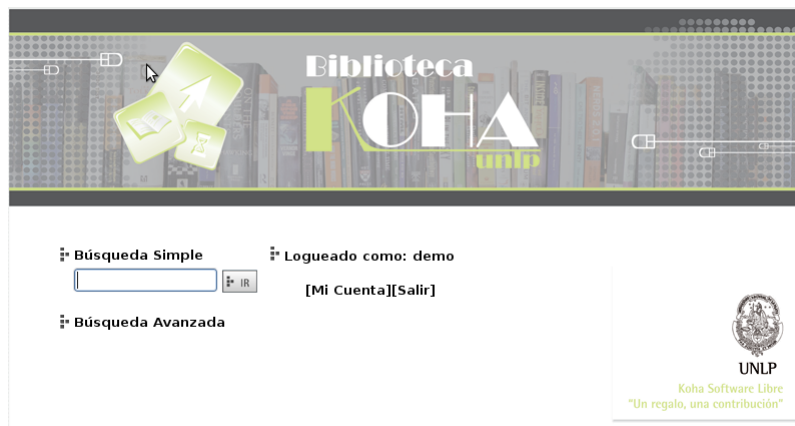
Figura 3. Opac Koha UNLP: interface pública