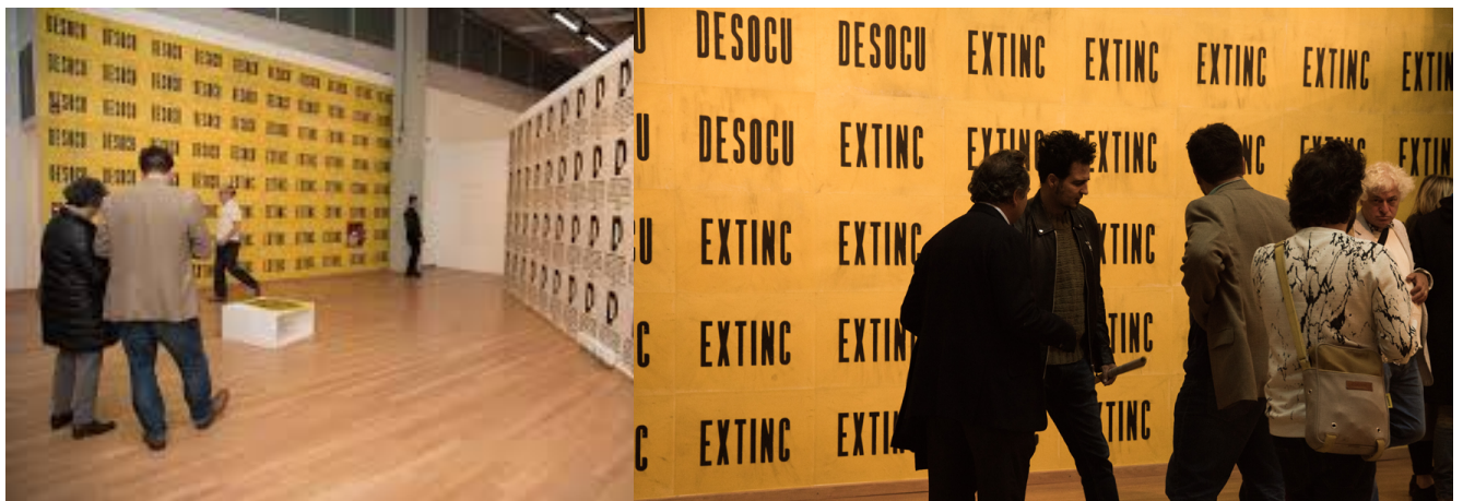
Figura 3 y 4. La Desaparición (2017) Juan Carlos Romero

simbólicos en el espacio. Para tomar en cuenta la relación entre el lugar de emplazamiento y la obra me interesa reflexionar sobre como Romero hace hincapié en el tema de la desaparición al emplazar la obra en el espacio de la sala PAYS del Parque de la Memoria. En este sentido propongo relacionar directamente el contenido temático de la producción plástica de este proyecto con el espacio del Centro de Arte UNLP, es decir desarrollando un montaje que instala los nombres e historias de estas artistas en un espacio que justamente se dedica a la circulación y a la difusión del conocimiento artístico. Además me interesa retomar de su obra ciertas características formales, como lo son la utilización del afiche, la repetición de imágenes y el gran formato.