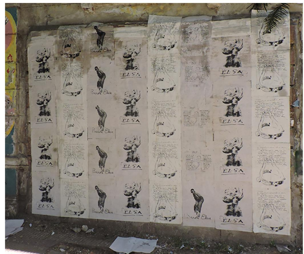
Figura 1. Objetos de Elsa Muestra final de Grabado 3 (2019) Figura 2. Pegatina Elsa (2019)

Las obras evocaban a la artista polaca Elsa von Freytag-Loringhoven que nació en 1874 y fue performer, modelo, prostituta, bailarina, actriz y poeta. Me intereso reconocer su trayectoria reivindicando el título de “madre” del ready made ya que existen diversos documentos y archivos, como el artículo de Joan Casellas (2011), que apuntan a la existencia de un enigma en torno a la autoría de la famosa obra La fuente (1917) del artista Marcel Duchamp. Según los cuales luego de que esta obra