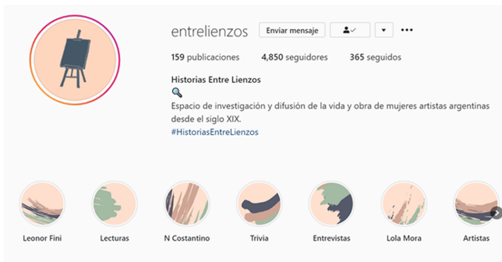
Figura 7. Perfil de Instagram Entre Lienzos.

Desde la cuenta de Instagram denominada "Entre Lienzos" tomo la recopilación de artistas y sus historias que realizan en sus posteos. Esta funciona como una plataforma que visibiliza artistas mujeres. Supe de la existencia de algunas de las artistas que retomo para este proyecto gracias al registro que realiza esta página. A partir de la investigación y la búsqueda, organizan una recopilación de artistas, mostrando sus obras y comentando en cada post información sobre su vida personal.