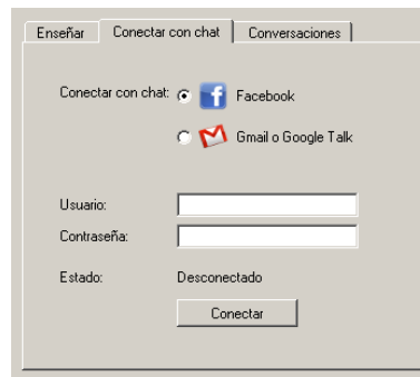
Figura 2. Ventana de conexión.