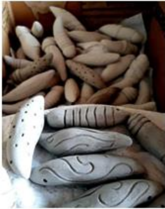
Figura 1 –Crisálidas en arcilla cruda