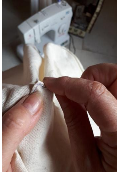
Costura a mano del bolsillo del vestido de niña.