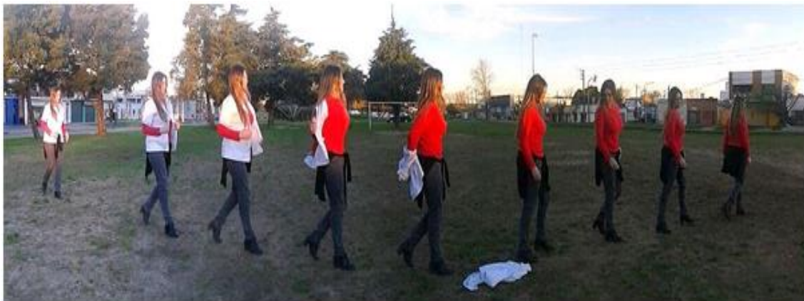
Figura 3- Fotografía tomada por la autora en el año 2015. Ejercicio para la materia Lenguaje Visual 2. Calles 17 y 31, ciudad de La Plata.

Este giro me permitió continuar indagando en mis producciones anteriores, nueva bibliografía, nuevos referentes artísticos, y es en esa búsqueda dirigida que me crucé, no por casualidad, con una fotografía tomada en el año 2015 para la cátedra de Lenguaje Visual 2. Tiempo y Espacio. Muda , referida a mi propia migración de la ciencia al arte. (Figura 3)