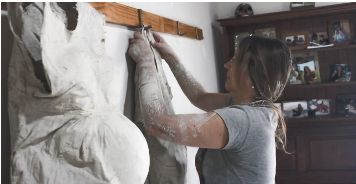
Colocación de la chaqueta de médica en el perchero, a continuación de las anteriores mudas, diciembre 2020.