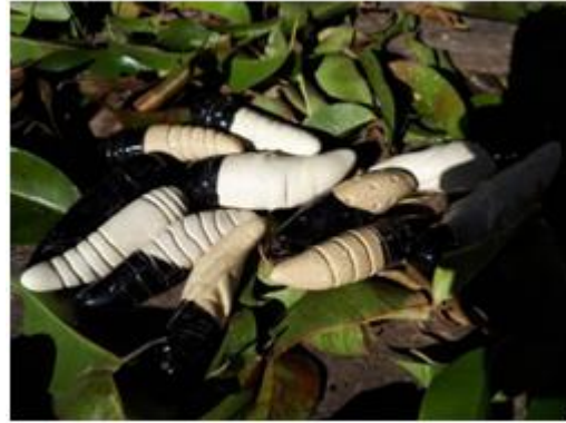
Figura 2- Crisálidas cerámica

Este giro me permitió continuar indagando en mis producciones anteriores, nueva bibliografía, nuevos referentes artísticos, y es en esa búsqueda dirigida que me crucé, no por casualidad, con una fotografía tomada en el año 2015 para la cátedra de Lenguaje Visual 2. Tiempo y Espacio. Muda , referida a mi propia migración de la ciencia al arte. (Figura 3)