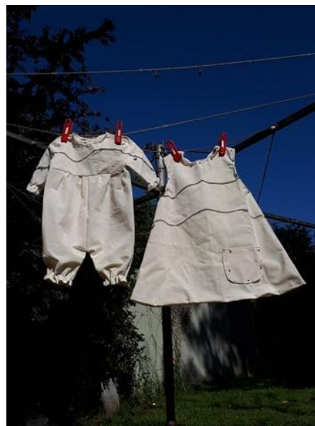
Prendas en proceso de proporcionalidad