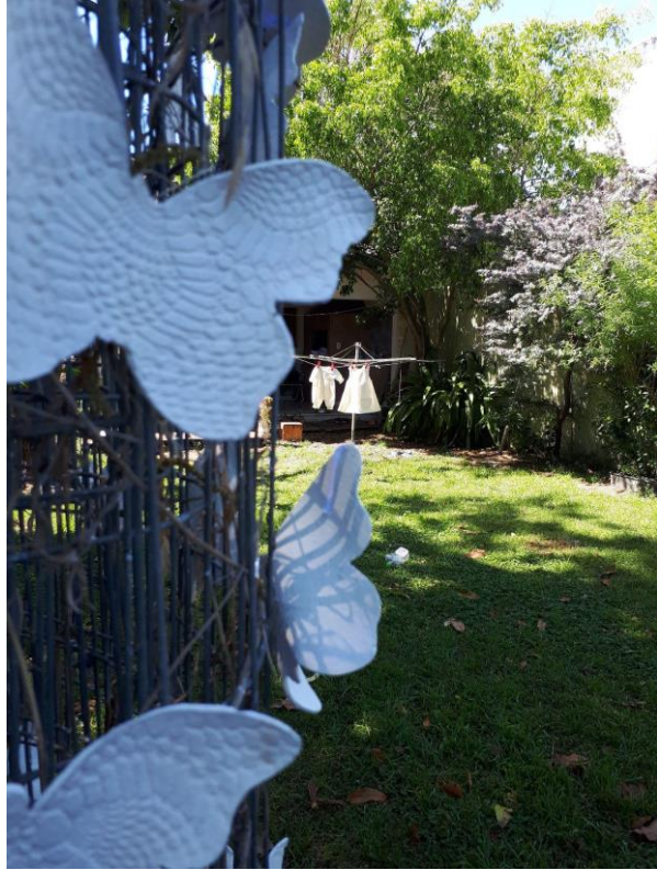
Ensamble de mis dos trabajos de Graduación final. Cerámica y Grabado-Arte Impreso, 2020