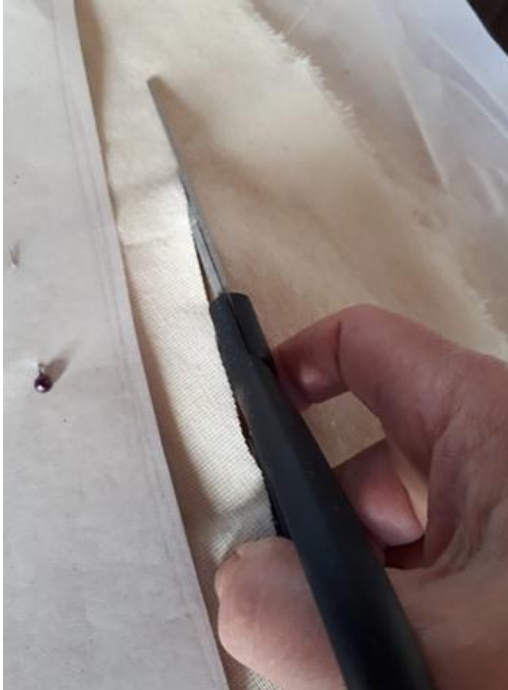
Realización de moldes de las supuestas ropas de mi infancia y corte de los mismos en liencillo, realizados en mi hogar en el mes de septiembre del 2020.