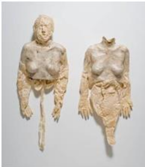
Hard Soft Bodies , Kiki Smith, 1992.

Resulta significativo para este proyecto la obra Hard Soft Bodies de 1992 donde se detiene en la piel como motivo, encontrando en el papel la materia frágil que traduce el órgano tegumentario. El resultado son caparazones de cuerpos vaciados de sustancia como si un molusco los acabara de abandonar.