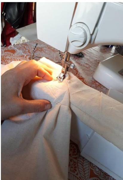
Costuras de las prendas.