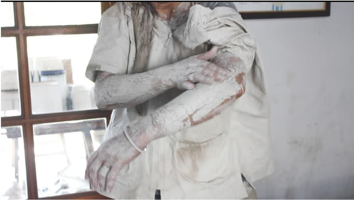
Inicio del retirado de la chaqueta de médica a modo de dejar mi crisálida para mudar-me