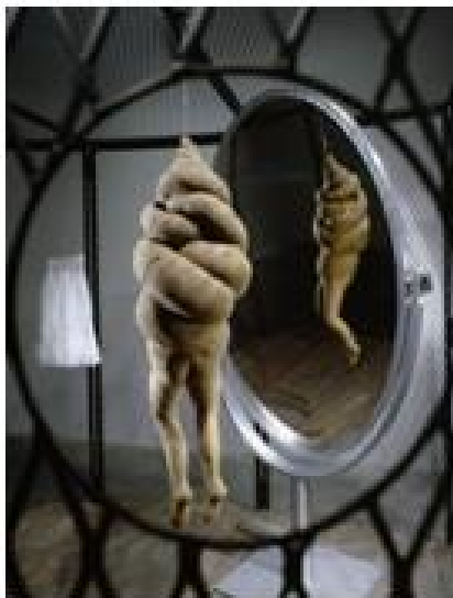
Cell XXVI, 2003, Louise Bourgeois.

En esta serie de piezas la artista representa situaciones de abandono, de traición y de pérdida que aluden a su propia biografía, a causa de la gran tensión que se vivía en la familia Bourgeois.