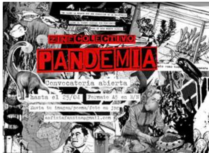
Figura 1: Flyer de la convocatoria para el "Zine Pandemia" editado por Asfixia en abril de 2020.