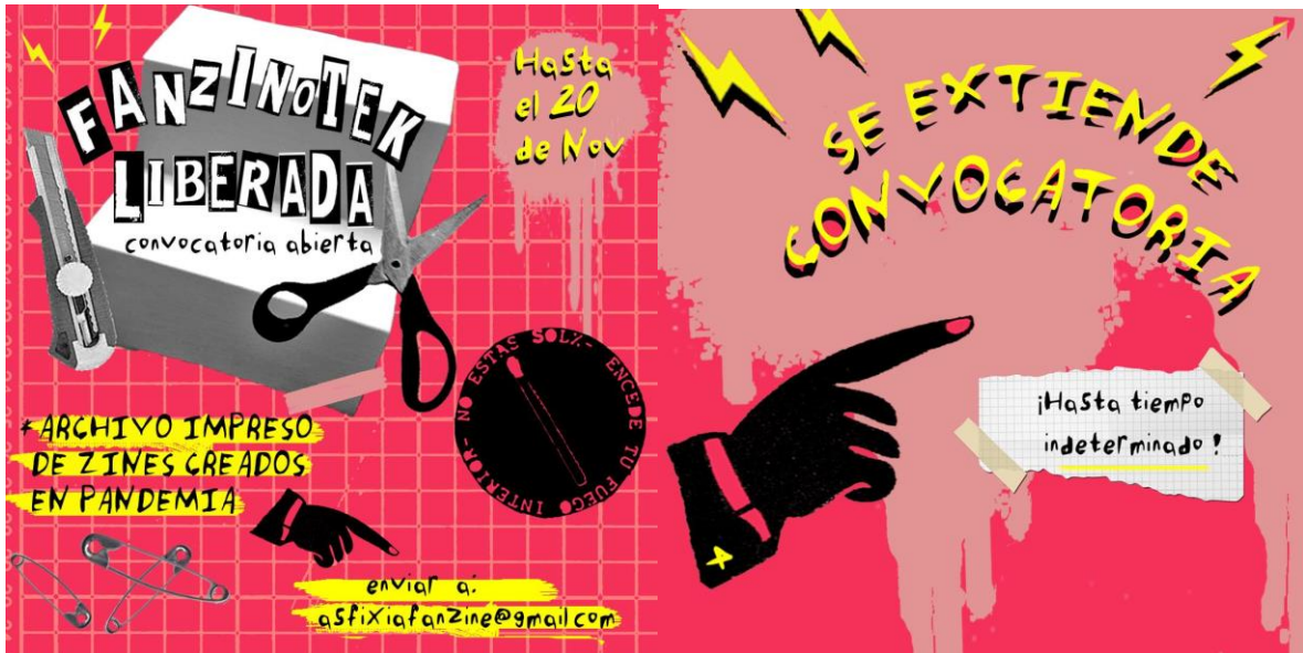
Figura 4: Flyer de convocatoria para la Fanzinoteka Liberada publicado en la plataforma Instagram.