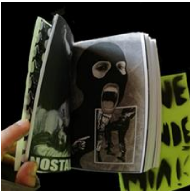
Figura 2: "Zine Pandemia" publicado por Asfixia en agosto de 2020.