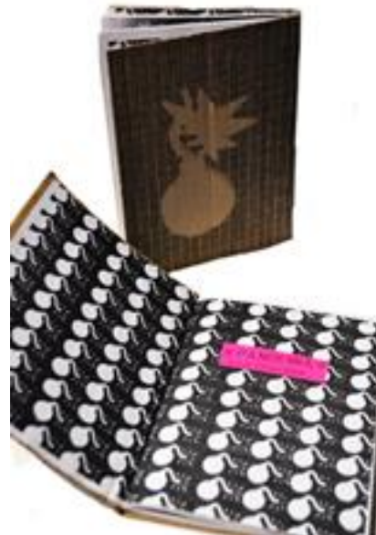
Figura 3: Reedición de "Zine Pandemia" desde ediciones cartoneras por Fungis.