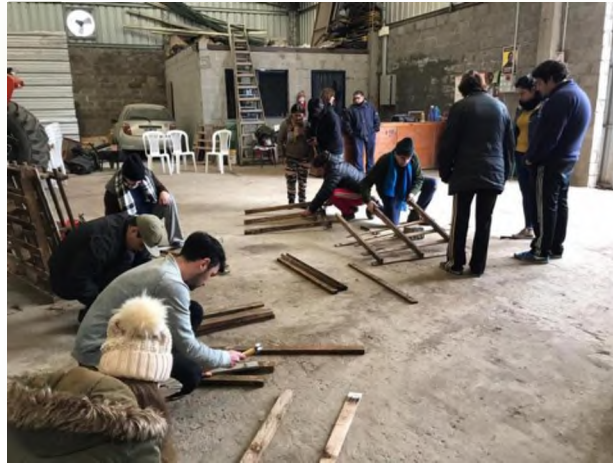
Figura 6: Capacitación en desarmado y limpieza de maderas

Con los listones recuperados preparamos primero 6 cabios largos y luego con ellos procedemos al armado de 2 estructuras o bastidores de 1,00 m x 2,40 superponiendo 0,30 m los listones. Escuadrando las estructuras. Ayudándonos con al menos 4 tablillas. (Figura6,7,8)