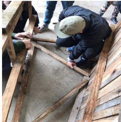
Figura 11: Colocación de montantes y diagonales listones enteros sin cortar.

El paso siguiente es el de vincular ambas estructuras formando el reticulado estructural