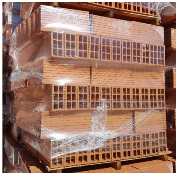
Figura 4: un Pallet del 8 (198 ladrillos 8/18/33 sobre pallet liviano)

A modo de ilustración en una obra de 200 m2 se utilizaron en total unos 50 pallets de ladrillos.