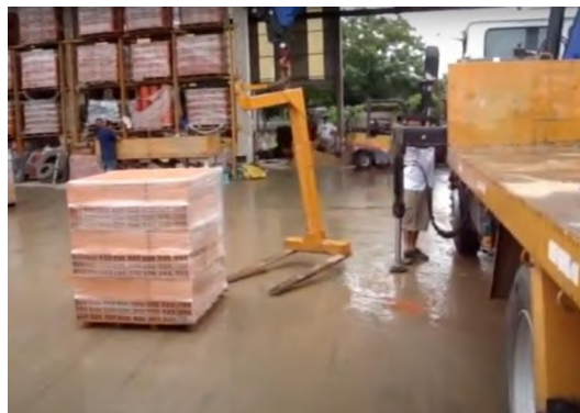
Figura 2: Camion moviendo ladrillos a través de hidrogrúa

Permitiendo agilizar las tareas y optimizar los tiempos de carga y descarga. (Figura2)