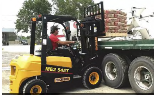
Figura 1: maquina autoelevadora cargando con pallet un camión

Se denomina Pallet a un bastidor de madera utilizado como soporte previo al embalaje para la distribución de materiales.