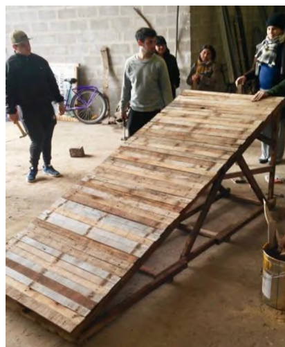
Figura 12: Módulo construido en 2 hs. por el grupo en Korn

Esto da paso a contar con el módulo estructural de techo autoportante listo para colocarse en obra (Figura11,12)