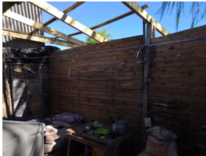
Figura 5: Ejemplo que ilustra la necesidad de un techo foto de actividad de campo en Barrio Santa Ana A.Korn S.Vicente

De las actividades relevadas en el territorio donde se aplicaría esta propuesta encontramos que la mayor urgencia estaba dada en poder techar sus viviendas y/o ampliaciones a las viviendas en que habitan. (Figura5)