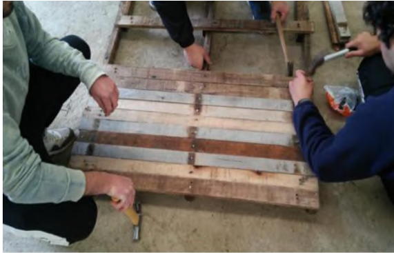
Figura 9: colocación de tablillas

El tercer paso es el de cubrir la estructura o bastidor superior con tablillas colocadas una al lado de otra clavada con clavos de 1,1/2" sobre cada listón con 2 clavos en coincidencia con cada listón, a modo de entablonado. (Figura9,10)