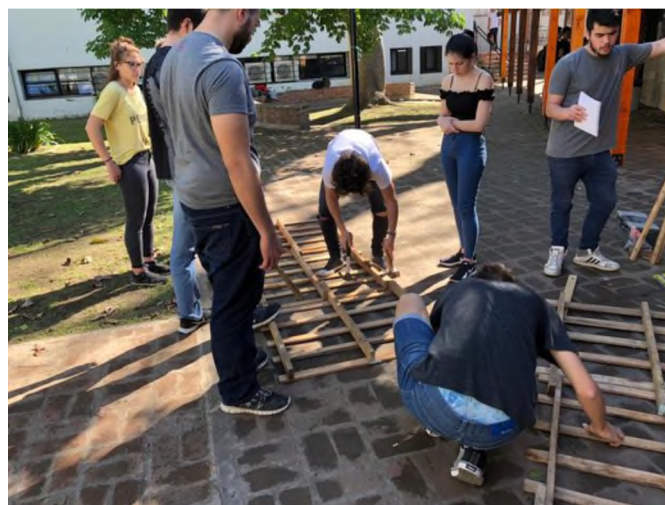
Figura 8: armado de estructuras o bastidores