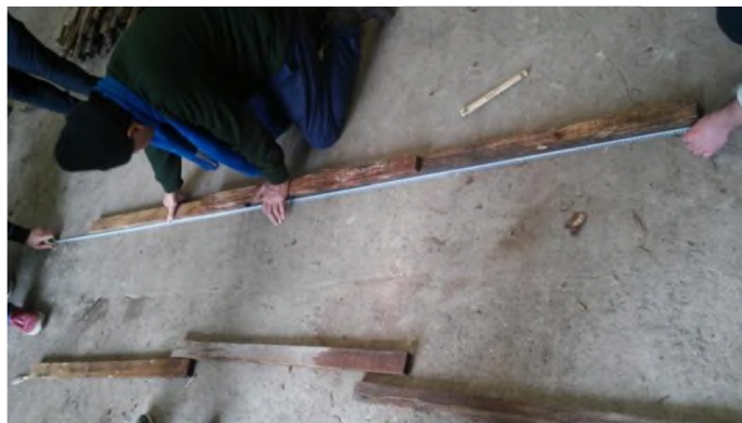
Figura 7: armado de cabios conformados por 3 listones.

Con los listones recuperados preparamos primero 6 cabios largos y luego con ellos procedemos al armado de 2 estructuras o bastidores de 1,00 m x 2,40 superponiendo 0,30 m los listones. Escuadrando las estructuras. Ayudándonos con al menos 4 tablillas. (Figura6,7,8)