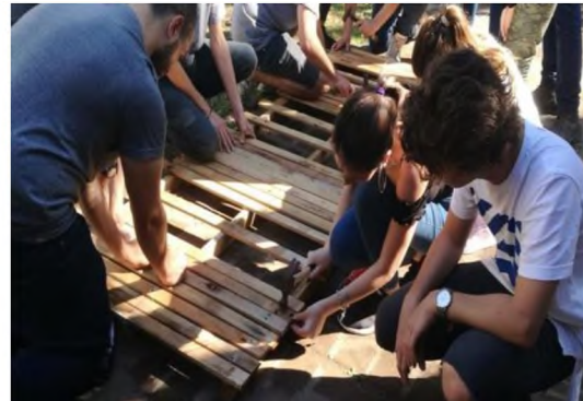
Figura 10: Panel casi terminado

El paso siguiente es el de vincular ambas estructuras formando el reticulado estructural