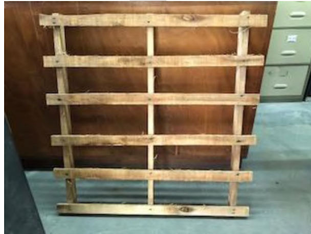
Figura 3: Pallet liviano usado en embalaje de ladrillos

Descripción se trata de un pallet liviano constituido por 3 listones de 1" x 3" (2,5 x 7cm) de un largo nominal de 1,00 m y 6 tablillas de 1/2" x 2" (1 cm x 5 cm) de similar largo. La madera es saligna sin cepillar. El armado es por clavado.