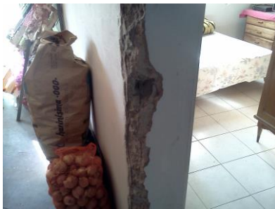
Figura 7 apertura de muro – armadura expuesta

Sin embargo, el prototipo según la Plataforma Crítica [Fiscarelli, 2016], indicaba limitaciones respecto de sus posibilidades de adaptabilidad. En relación con la idea de flexibilidad, la semejanza dimensional de los ámbitos constituía su principal recurso proyectual. Esto redundaba en un intercambio de uso que la Unidad Doméstica consideraba a su favor: el dormitorio matrimonial funcionaba como sala de estar en continuidad con la ampliación destinada a la actividad comercial. No obstante, la problemática surgió con la demanda de superficie adicional –crecimiento. Atendiendo a este objetivo, los criterios de compatibilidad tecnológica quedaron restringidos a las decisiones de los usuarios. El prototipo no ofrecía ninguna indicación sobre