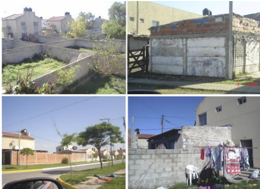
Figura 2 relevamiento adaptaciones en viviendas