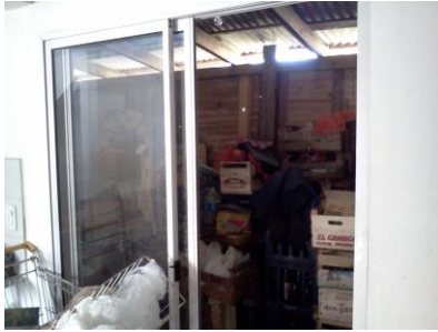
Figura 6 puerta ventana – fachada al fondo