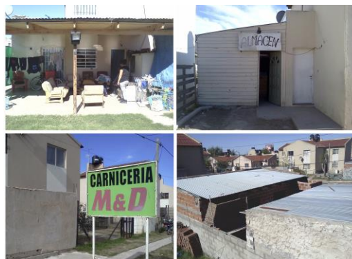
Figura 3 relevamiento adaptaciones en viviendas