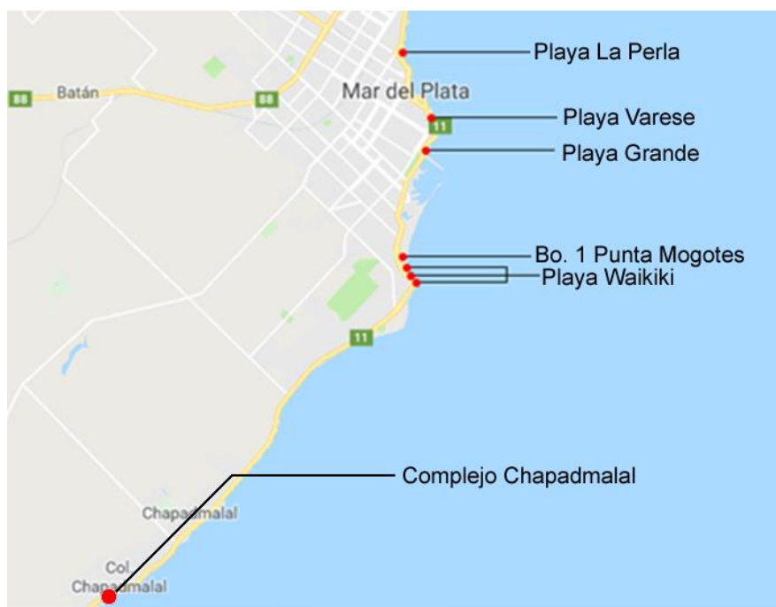
Ilustración 1 – Costa de Mar del Plata, Provincia de Buenos Aires, Argentina. Los puntos rojos indican los sitios en que fue llevado adelante el trabajo de campo de la investigación (entrevistas y observaciones).

Es decir que como investigadores estuvimos muy cerca de las prácticas del surf marplatense, en algunos casos inclusive hasta participando de sesiones dentro del agua, en un codo a codo con otros practicantes. Tratando de hacernos un lugar en ese mundo del surf y adquiriendo elementos que nos permitieran comprenderlo mejor. Si bien no utilizamos una guía estructurada de observación, algunos de los ítems relevados fueron: Las conductas motrices desplegadas por los surfistas (posturas adoptadas, formas de ponerse de pie, tipos de desplazamientos), los modos de entrada y salida del mar, los tipos de tablas y equipamientos o accesorios utilizados, entre otros aspectos. La duración de cada sesión osciló entre 45 y 90 minutos. Todas las observaciones fueron relevadas en un cuaderno donde registramos de manera sistemática aquello que acontecía o que nos parecía significativo.