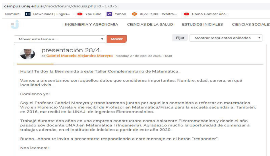
Figura 2: Ejemplo de las “capturas de pantalla” enviada por una docente, acompañada de la explicación sobre el sentido de esta.

Primera captura: lenguaje positivo, ante una situación adversa como el aislamiento, muchos de los estudiantes, tienen que ir despacio ante la plataforma... si hay algo obvio para mí, como el indicar “hace click” debo pensar que del otro lado hay alguien que está con un celular y “presiona el botón responder” suele ser más efectivo.