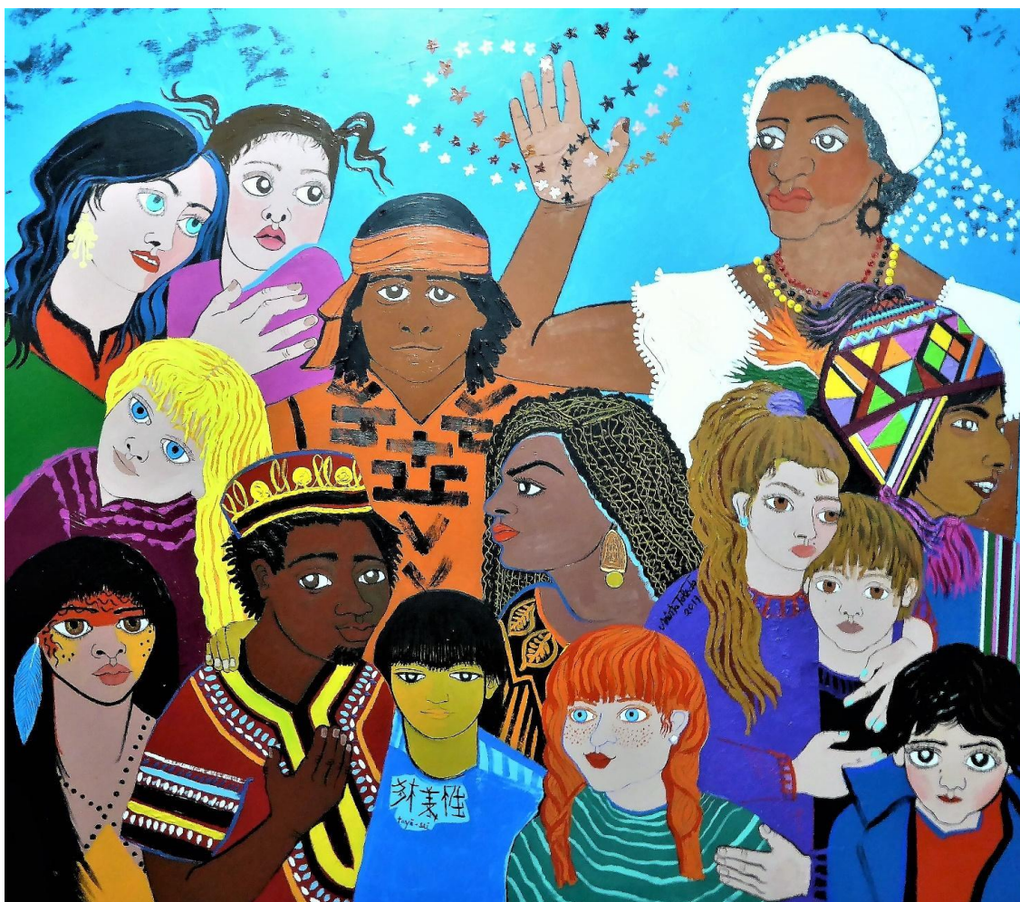
Figura 1. El otro: pura diversidad . Mirta Toledo, 2017.

En estas obras, Toledo no solo quiere mostrar la diversidad, sino alertar sobre la hegemonía de la imagen de belleza y los estereotipos. Así, dice: