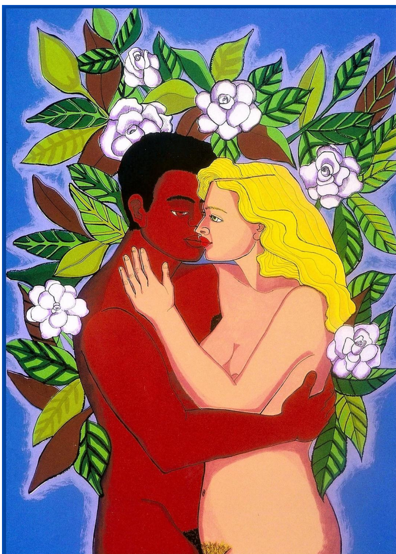
Figura 2. El Árbol de la Vida: Toribio y Eva, mis padres . Mirta Toledo, 2004.

La serigrafía de una pareja desnuda besándose, en la que el hombre es negro y la mujer blanca y rubia, remite directamente a sus padres, subraya las diferencias étnicas entre ellos y simboliza la lucha contra el racismo (Figura 2). Asimismo, sus padres vuelven a aparecer en dos collages realizados con fotos de sus rostros, donde también resalta la divergencia entre los rasgos físicos de ambxs (Figura 3). Allí colocó, además, palabras recortadas de periódicos o revistas. Es interesante destacar que en el que trata sobre Toribio, su padre, la palabra que emerge con mayor pregnancia es “invisible” en letras blancas sobre un fondo negro.