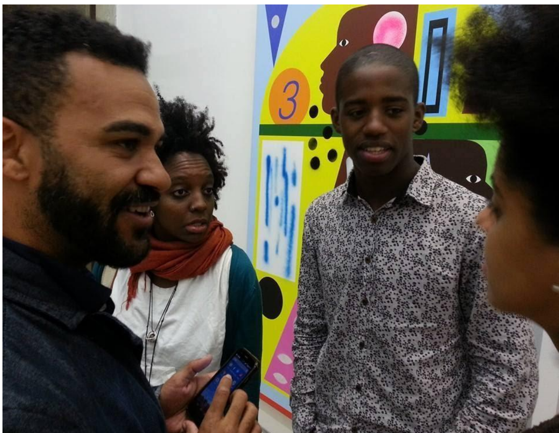
Figura 1. Participantes en Presença negra , 2015.

Presença negra (Figuras 1 y 2) se realizó en espacios de exposición importantes de São Paulo, como las galerías Millan, Luisa Strina, Mendes Wood DM y la sede de la galería británica White Cube. Durante la performance , el grupo formado por artistas, escritorxs e intelectuales negrxs que habían llegado de forma separada se mantenía en silencio, sin actuar de forma estridente. Sin embargo, su sola presencia, paradójicamente, era lo más provocador de la muestra. No solo el color de la piel, sino también los turbantes, los cabellos crespos y trenzas se destacaban frente a la normalidad blanca de estos espacios. Ellxs eran el objeto de las miradas del resto de lxs asistentes. El personal que formaba parte del equipo de las galerías se preguntaba si eran extranjeroxs o invitadx especiales. Asimismo, Patrício cuenta una anécdota que merece ser mencionada, en la cual, mientras se desarrollaba la performance , una empleada le solicitó un fotógrafo que no enfocara hacia aquella “gente estranha” (en Martí, 3 de febrero de 2015).