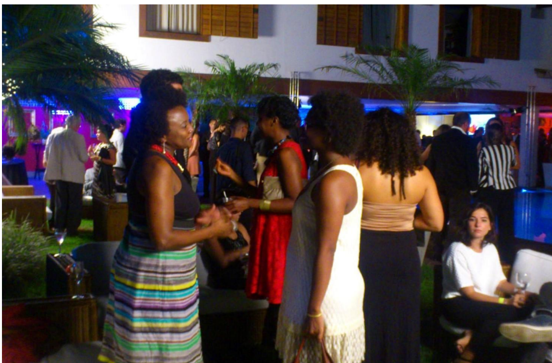
Figura 3. Participantes en Presença negra , 2015.