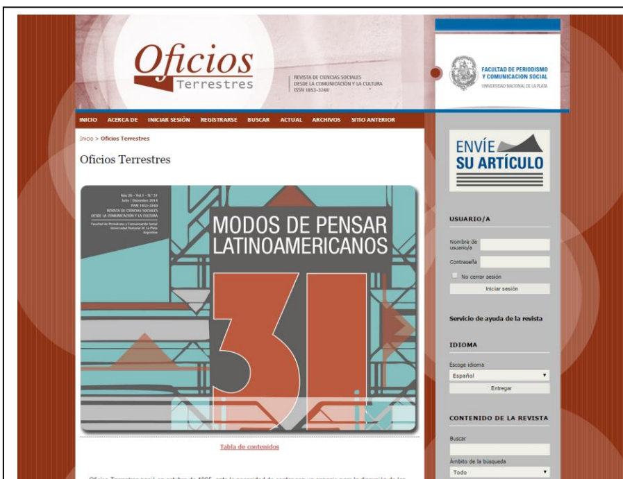
FIGURA 8 Portada de Oficios terrestres (700 px por 510 px)

Si bien el planteo original de composición de las portadas se realizó en un formato similar al de las utilizadas por las publicaciones impresas, finalmente se optó por una pieza que se ajusta en ancho al espacio principal de la home y en alto a la medida que permita visualizarla de manera completa cuando se accede al sitio [Figuras 8, 9 y 10].