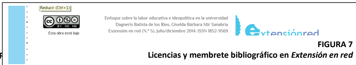
FIGURA 7 Licencias y membrete bibliográfico en Extensión en red

Dado el carácter electrónico de las publicaciones, en todos los casos en los que es posible, los datos se ofrecen con el hipervínculo que permite acceder a la información. Hasta el momento, este recurso se aplica a la URL de la revista, a las licencias CC y a las referencias electrónicas. 1164