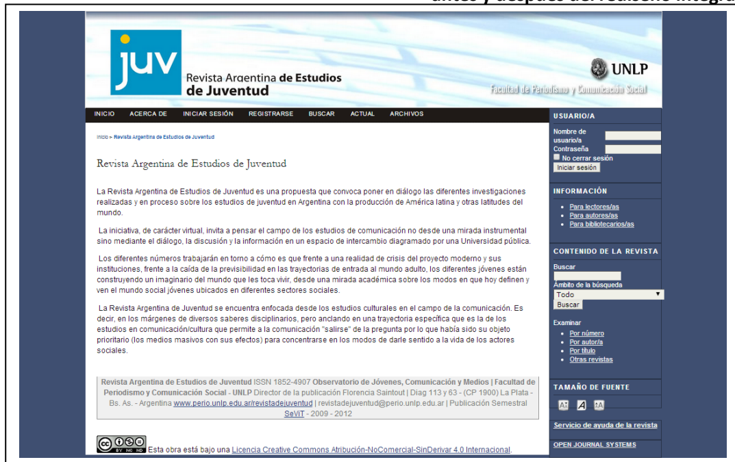
FIGURA 6 Entorno de Revista Argentina de Estudios de Juventud, antes y después del rediseño integral

El montaje de los entornos, que por cada revista se realizó en un solo paso, incluyó: el reemplazo del encabezado completo; la inclusión del fondo; el rediseño de la columna de navegación derecha, en la que incorporó, además, un acceso directo al envío de artículos; el armado del nuevo pie institucional, enmarcado en el color predominante de la marca; y el cambio de color de la barra de navegación superior y de todos los hipervínculos que ofrece el sitio.