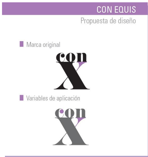
FIGURA 2 Diseño de marca para la revista Con X