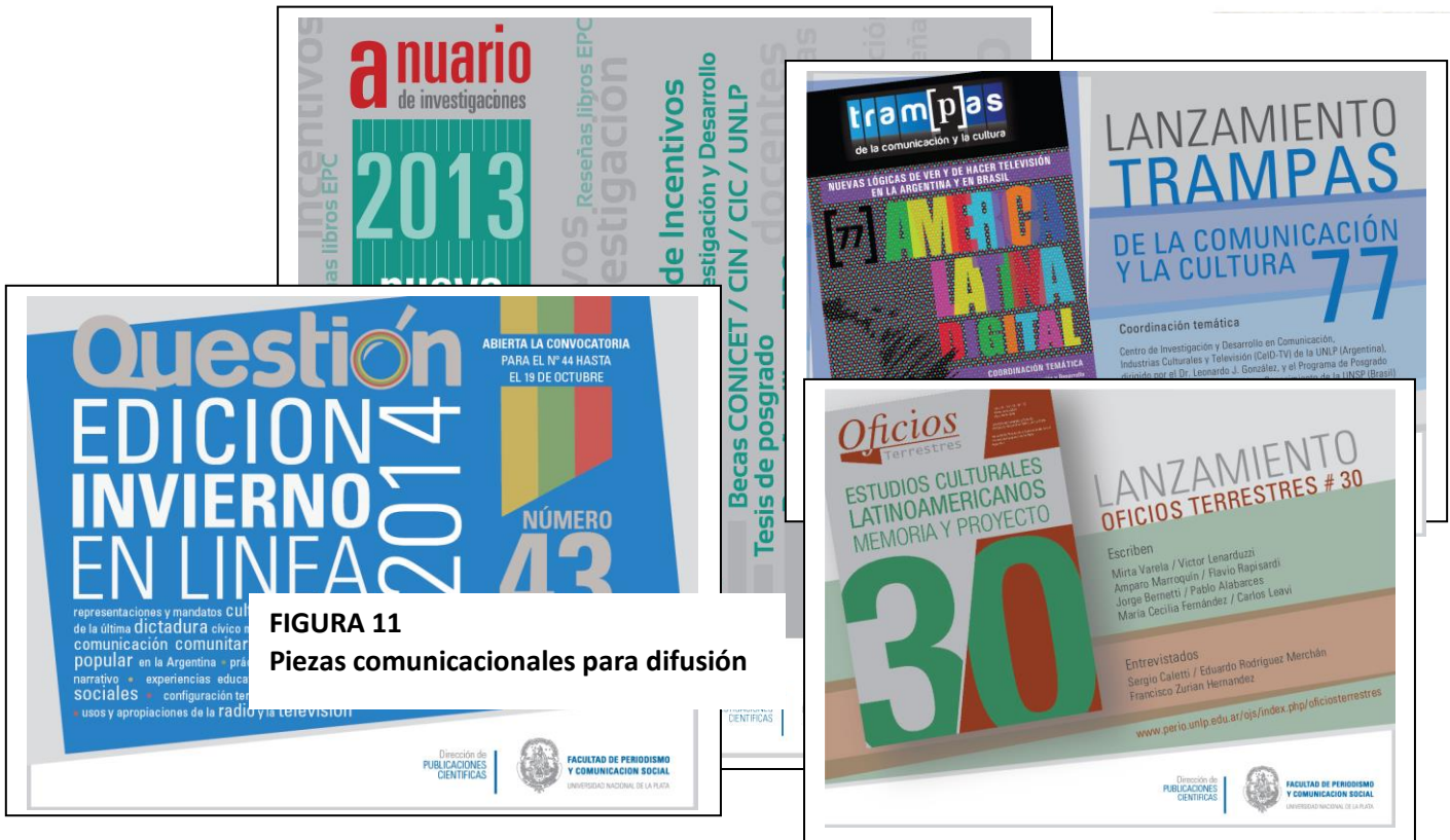
FIGURA 11 Piezas comunicacionales para difusión