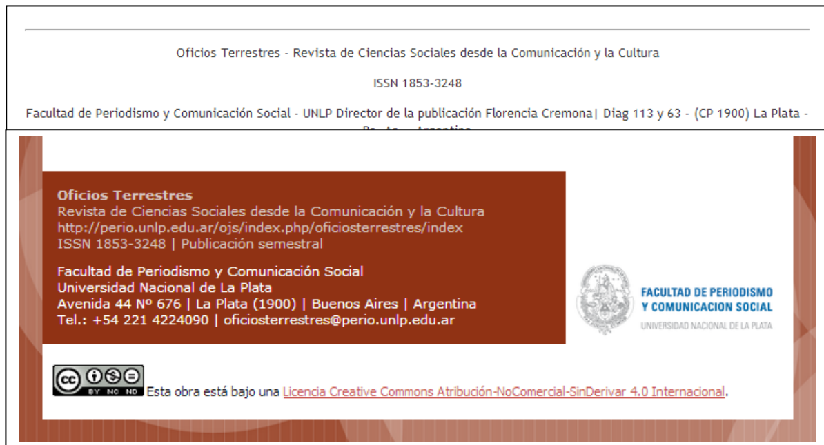
FIGURA 5 Zócalo de Oficios Terrestres , antes y después de la normalización de los datos editoriales e institucionales

En línea con los requerimientos que fijan para estos espacios los organismos de información científica, se normalizaron los datos que ofrecen las revistas en los pie institucionales: en el primer bloque se agruparon las referencias específicas a cada publicación (nombre, enfoque y alcance, URL, ISSN y periodicidad); en el segundo, se concentraron los datos de institucionales y de contacto (Facultad, Universidad, dirección, ciudad, provincia, teléfono y correo de la revista) [Figura 5].