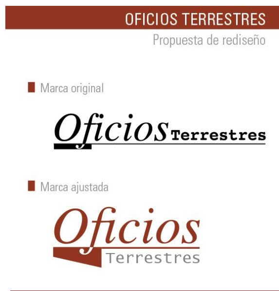
FIGURA 1 Ajuste de marca para la revista Oficios Terrestres

En todos los casos, el primer paso de la intervención en el diseño visual de los sitios consistió en actualizar las marcas de las revistas. En algunas publicaciones, esto supuso el ajuste de las marcas existentes [Figura 1]; en otros, implicó la realización de un nuevo diseño [Figura 2].