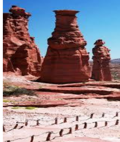
Figura 4. Parque Nacional de Talampaya