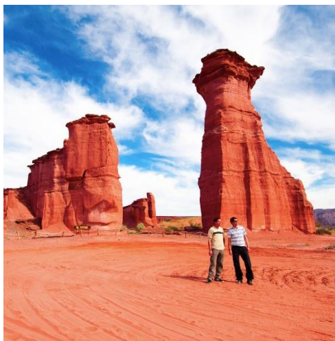
Figura 3. Parque Nacional de Talampaya