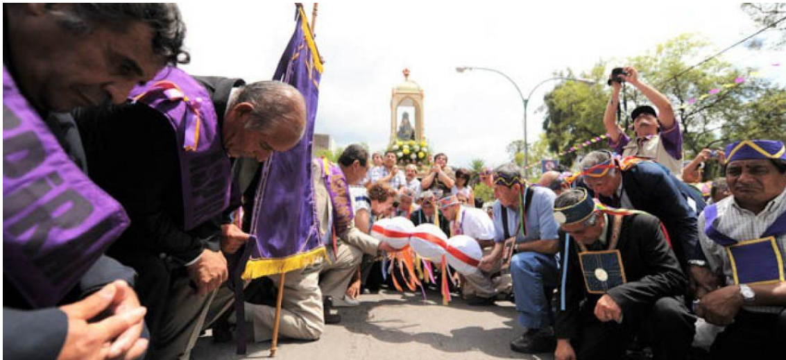
Figura 13. Una de las genuflexiones ante el Niño Alcalde