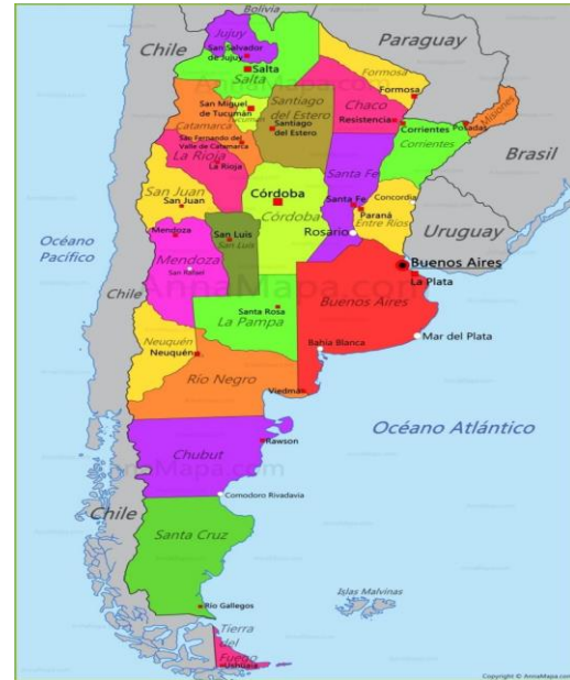
Figura 2. Mapa de la República Argentina