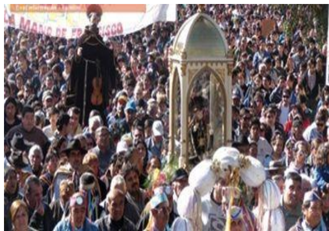
Figura 9. El Niño Alcalde, San Francisco Solano, la cofradía de los allis , promesantes y fieles