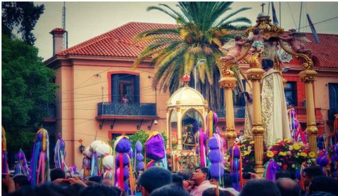
Figura 14. Un momento del Tinkunaco frente a la Casa de Gobierno