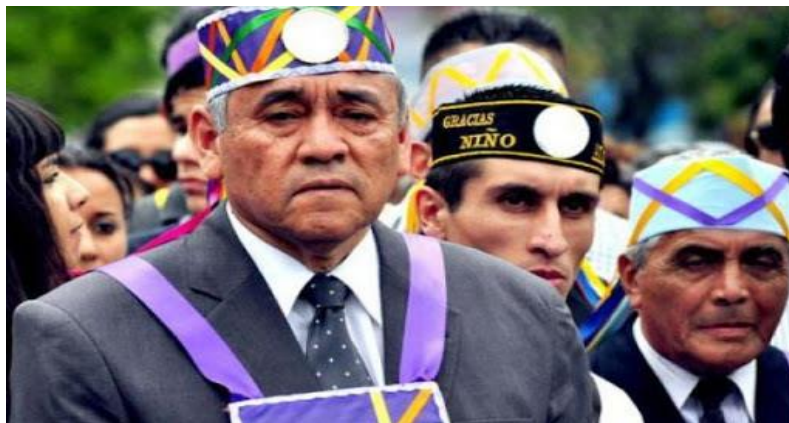
Figura 8. La cofradía de los allis