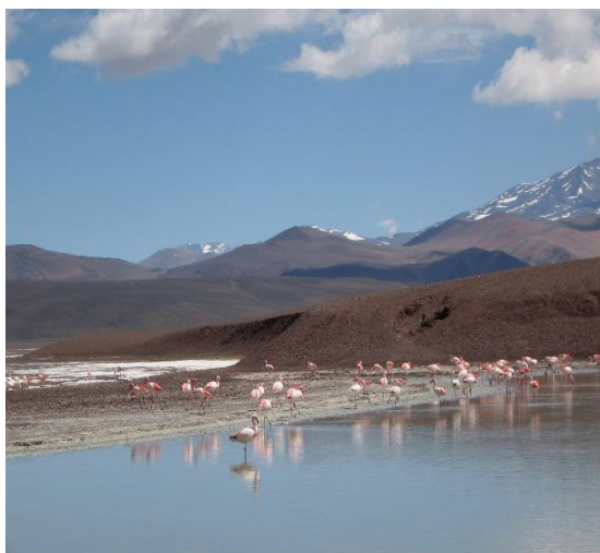
Figura 5. La Laguna Brava, La Rioja, Argentina