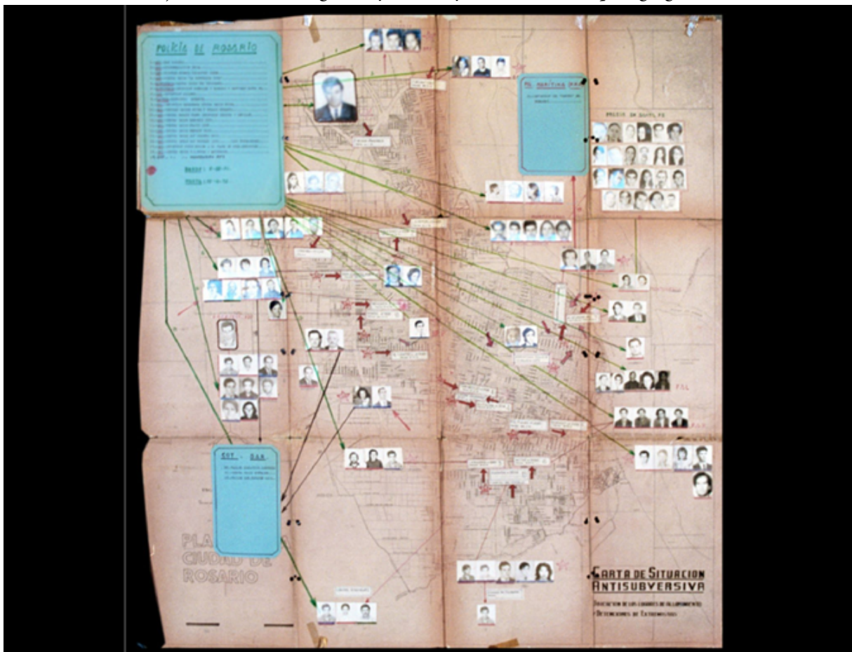
CPM -Fondo DIPPBA- Mesa "DS" (delincuente subversivo) Legajo 641.

Mapa de Rosario elaborado por el Jefe de policía de la ciudad, donde se señalan los domicilios de militantes junto con sus fotografías y se incluyen anotaciones que agregan información