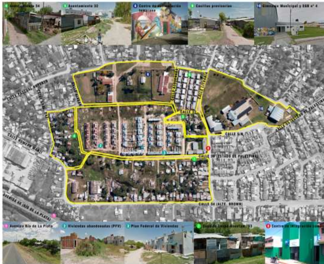
Fig. 4. Unidades de Análisis San José Obrero BERRISO Elaboración propia.