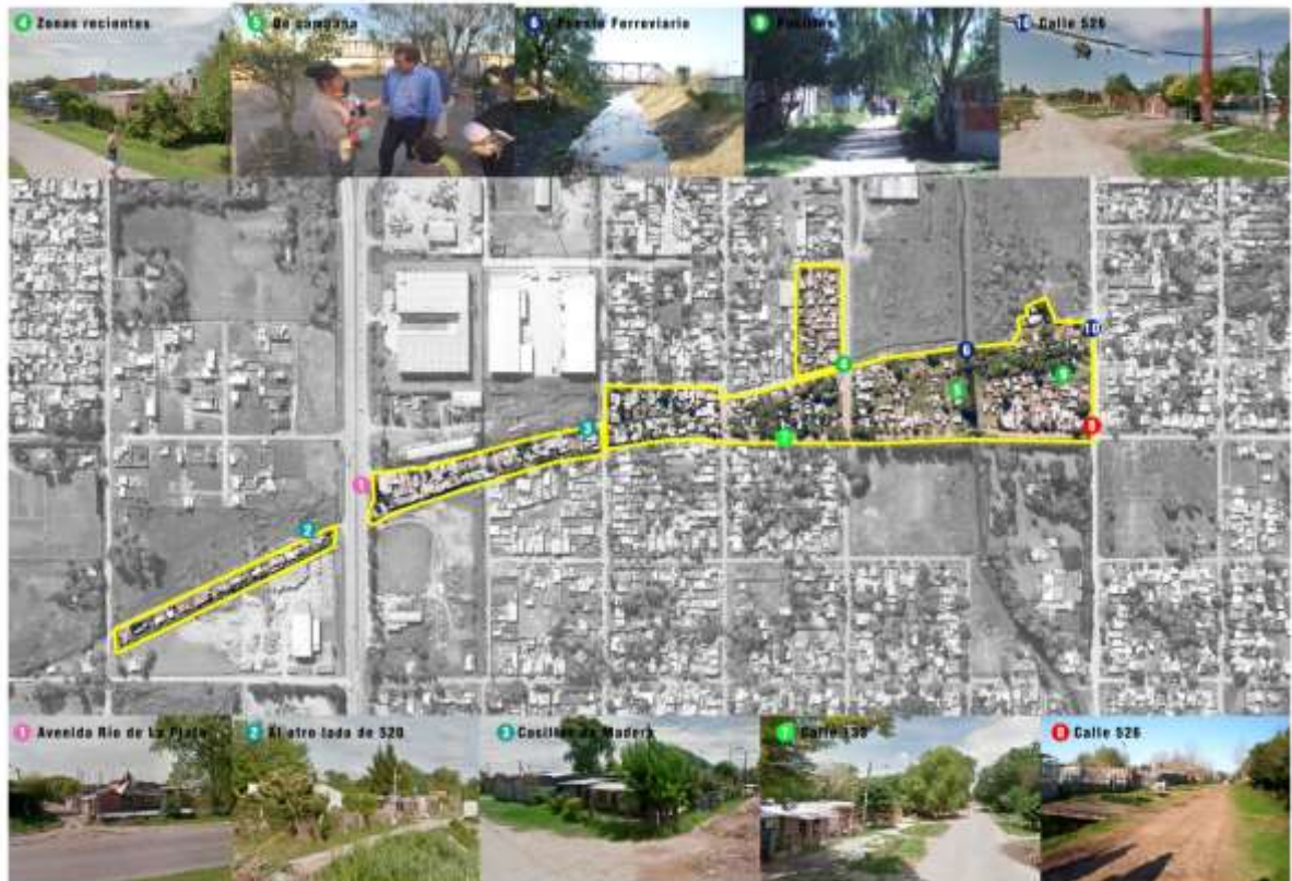
Fig. 4. Unidades de Análisis "Las Vías" LA PLATA Elaboración propia.