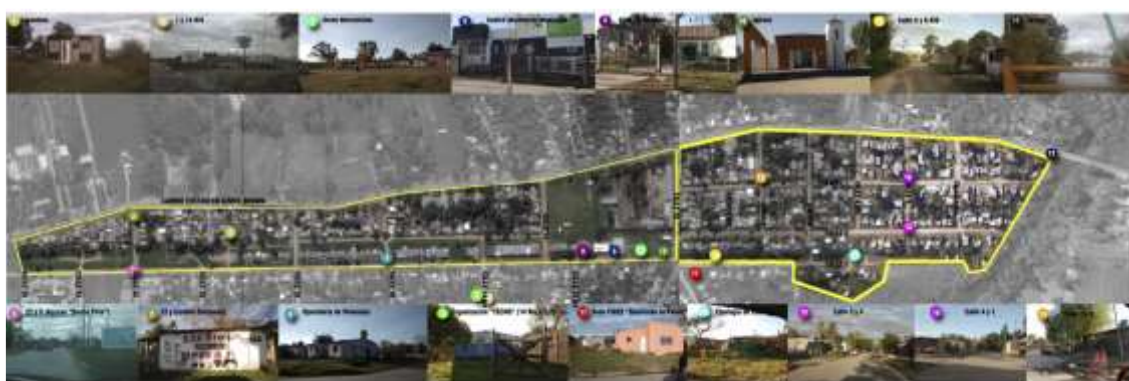
Fig. 3. Unidades de Análisis ENSENADA Elaboración propia