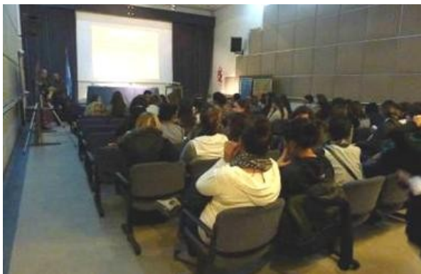
Figura 5. Charla a cargo de especialistas en el auditorio del museo.