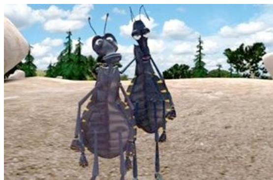
Figura 3. Imagen tomada del video “Cada quien para su casa, la enfermedad de Chagas”(México, 2008).

Se incluyó este video en la charla del día martes y se proyectó de manera continuada en la Sala Víctor de Pol durante el fin de semana.