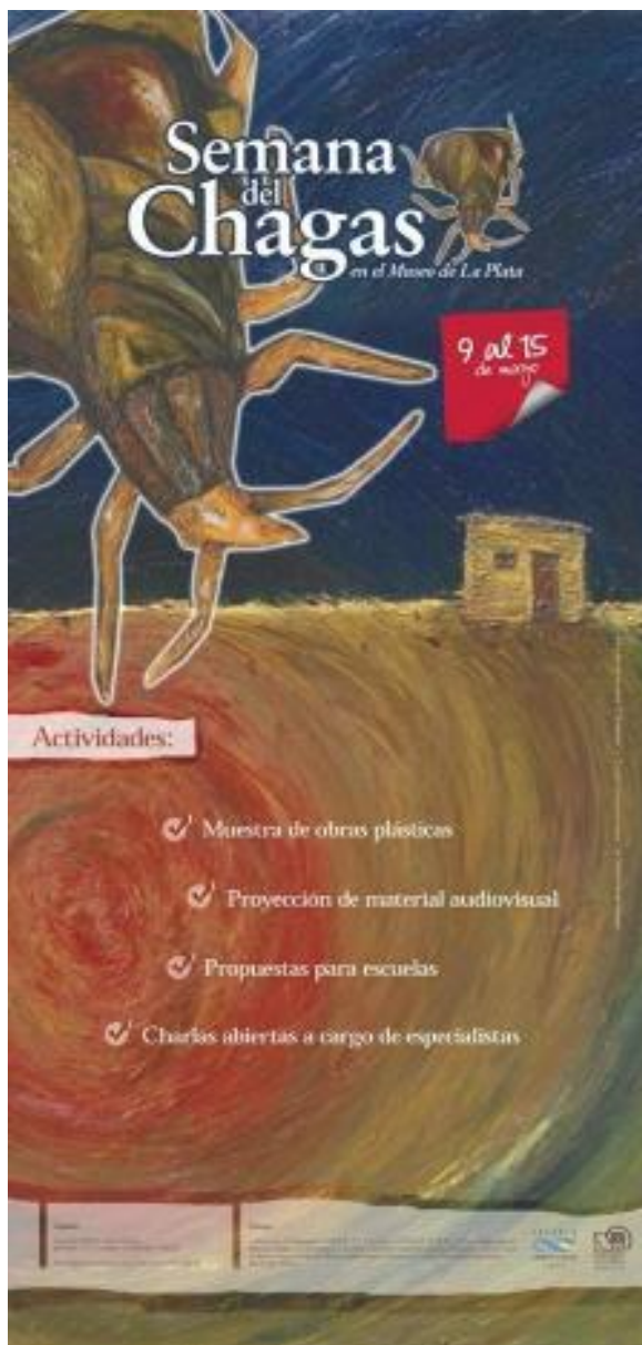
Figura 3: Banner de difusión de la Semana del Chagas en el Museo de La Plata (La Plata, mayo de 2011).

acordes a las características de los escenarios actuales (urbano y global, además de rural y latinoamericano). En este sentido, y para modificar la gran distancia que separa al “universo” de la producción científica, de las poblaciones afectadas, es necesario apuntar al desarrollo de estrategias y acciones que no estén orientadas sólo a evitar la enfermedad, sino a la promoción de la salud de las personas. A partir de estas consideraciones elaboramos “CHAGAS. Reconocer miradas, sumar voces,