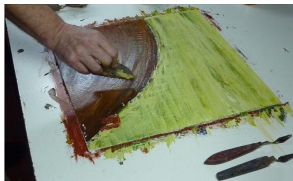
Figura 4: Imagen tomada durante la realización de “CHAGAS. Reconocer miradas, sumar voces, acortar distancias...” (Córdoba, septiembre de 2010).

La propuesta aborda generalidades de la problemática desde una mirada integral, utilizando como soporte visual un video ilustración que muestra el proceso creativo de la realización de 5 imágenes en acrílico que ilustran los ejes temáticos del texto (Figura 4). En el proceso mismo de su realización se buscó dar lugar a la pluralidad de actores implicados con lo que el texto, la estructura, la imagen y el sonido (tanto de la música como de la voz) se conjugaron reflejando las particulares interpretaciones y sentires de los participantes para dar lugar a una obra colectiva con identidad propia.