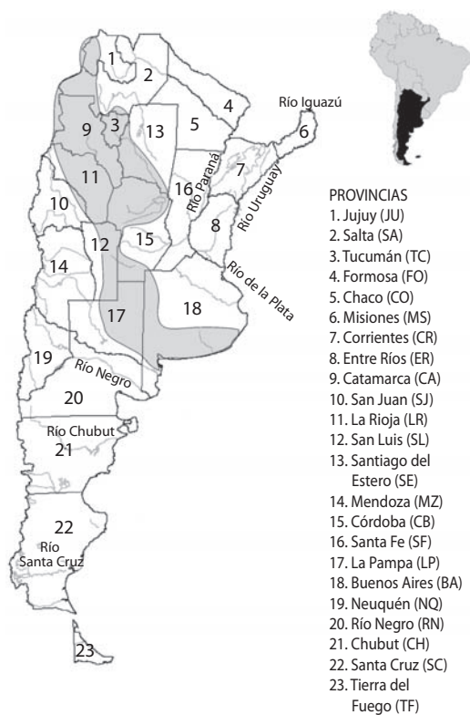
Fig. 1. República Argentina con los principales ríos y provincias. Área gris: Zona de Transición.