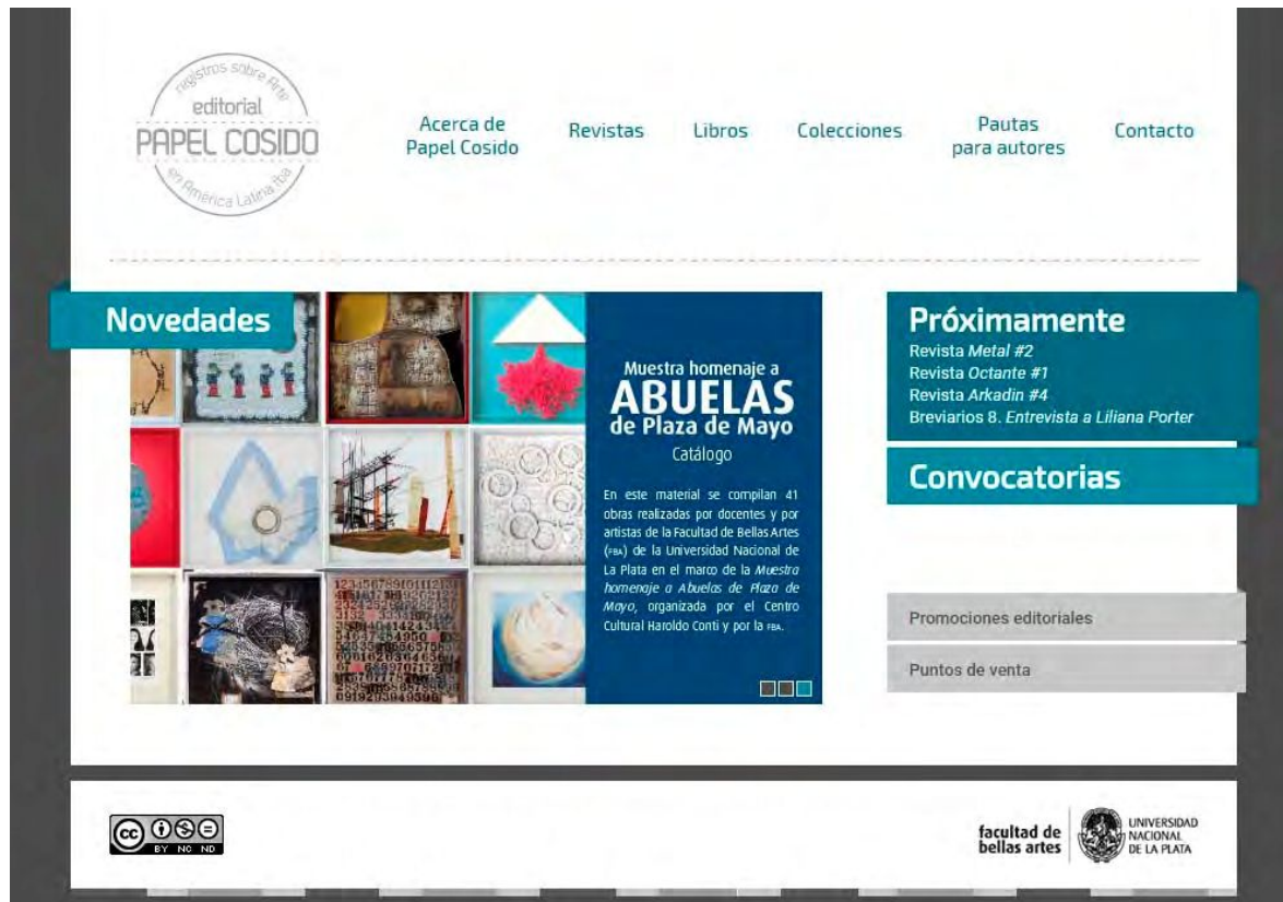
Figura 3. Pantalla de inicio a la página de Papel Cosido

Este trabajo de producción y de desarrollo de la estructura y de los contenidos del catálogo digital de papel cosido —cuya instancia de diseño estuvo a cargo de la Dirección de Diseño de la FBA y su desarrollo web, de la DAE— no sólo consiguió reflejar la totalidad de los materiales editados por la Facultad, sino también la mirada social, histórica y política que se lleva adelante y que se impulsa desde esta institución. Las editoriales universitarias tienen como objetivo “brindar un servicio de difusión de la cultura, de conocimiento o de preceptos morales, políticos o religiosos a través de materiales impresos” (Estéves Fros & Vanzulli, 2009: 37). De este modo, sus materiales son el espejo de su mirada del mundo.