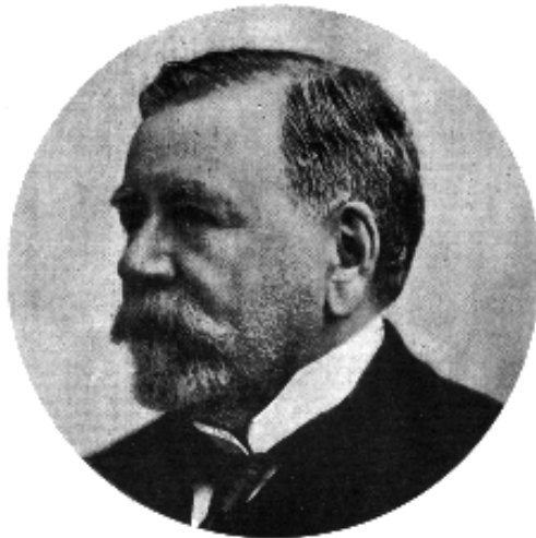
Dardo Rocha, fundador de la ciudad de La Plata y rector de su primera universidad.

El presente trabajo aborda el ámbito de la cultura laica platense en relación con las principales instituciones culturales de la ciudad (Universidad, Museo de Ciencias Naturales, Observatorio, Biblioteca Municipal, Escuela Normal, sociedades populares de educación, etc.) y con el desarrollo local de un movimiento político identificado estrechamente con el laicismo y con la gestión en los aparatos de estado, dentro de el área de la educación y la cultura; el movimiento librepensador. Trazando un panorama de las iniciativas laicistas platenses, nos detendremos con particular atención en las que se propusieron trabajar en el seno de la clase obrera local relacionando la universidad y las demás instituciones educativas con el pueblo. Tomaremos como límites temporales los años 1896-1897 en que las primeras agrupaciones librepensadoras comenzaron su actuación pública en La Plata, coincidentemente con la instalación de la universidad provincial, embrión de la futura universidad nacional; y el año 1919 cuando el movimiento de la reforma universitaria iniciado en Córdoba llega a la Universidad Nacional de La Plata y lo hace con una virulenta huelga que quedará en la historia de la capital bonaerense. A manera de síntesis, nos proponemos aportar elementos para un mayor conocimiento de la atmósfera intelectual platense en las primeras décadas del siglo e indagar sobre su proyección en el movimiento reformista.