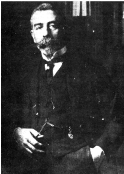
Joaquín V. González, fundador de la Universidad Nacional de La Plata.

Este modelo tan avanzado en el contexto de la época será duramente impugnado por el movimiento reformista que en 1919 llega a La Plata con una huelga que cuestionó la “oligarquía de profesores”. Al contrario del movimiento reformista cordobés que barrió con una universidad clerical, nepotista y arcaica; el movimiento platense se enfrentó con una universidad laica, abierta a los avances académicos e intercambios internacionales y orientada a la intervención en el campo social. Modelo que sin embargo encontraba sus límites en concepciones sumamente polarizadas sobre los sujetos educativos (instruido/no-instruido) y que compartía con la cultura científicista de ese entonces una visión igualmente polarizada de la sociedad dividida en aptos y no aptos a los que la educación iría preparando muy gradualmente para la participación de pleno derecho en su destino. Al desafío de los estudiantes que reclamaban la participación en los asuntos de la universidad, el viejo orden académico presentó una oposición cerrada, desatando el conflicto del que nació otra universidad. La universidad de los años '20 conservó la tradición laica pero le agregó las banderas de la Reforma y la vocación americanista. Pero esa ya es otra historia.