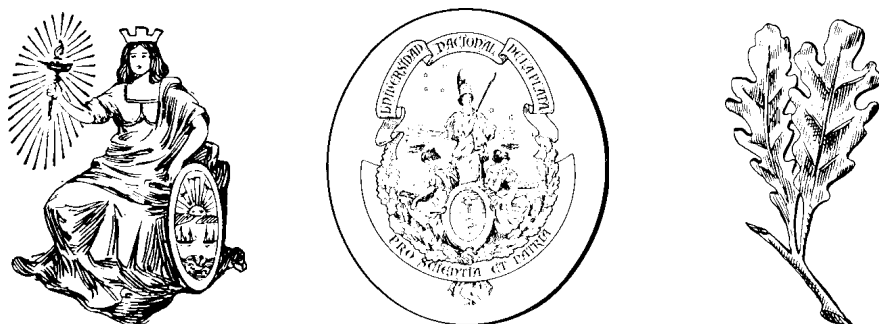
Figura que llevó el sello de la Universidad -provincial- de La Plata; primer escudo de la Universidad Nacional de La Plata y la hoja de roble, el distintivo que adoptaron los universitarios platenses.

Está en vías de funcionar una escuela para niños y otra para adultos. Para ello se han solicitado bancos y útiles al Concejo Escolar. Forman parte del Comité de La Plata, bastante elemento docente, y ello permite esperar una propaganda eficiente para despertar una mayor cantidad de trabajadores, sobre todo en Tolosa, donde están ubicados los grandes talleres del Ferrocarril Oeste 15 .