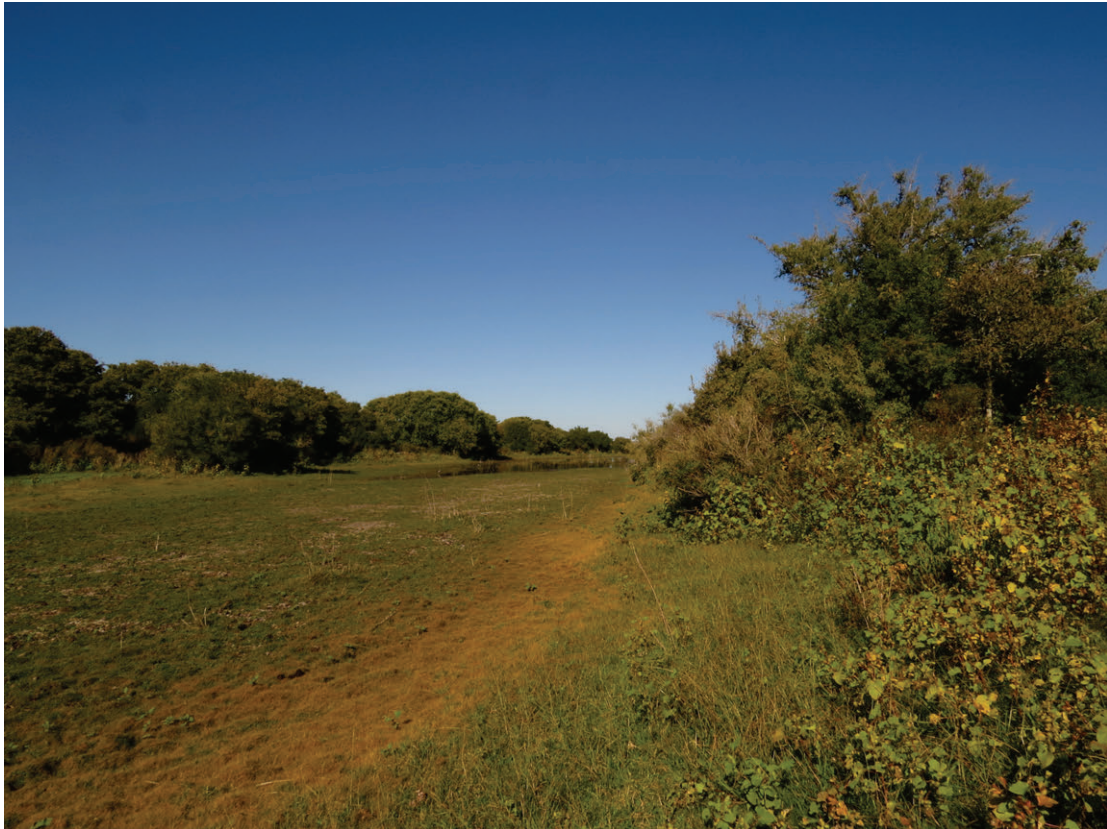
Figura 1. Imagen del bosque nativo donde realizamos las observaciones, en la Estancia La Matilde, Punta Indio, Buenos Aires.

Figura 1. Native forest's Image where we made the observations, at Estancia La Matilde, Punta Indio, Buenos Aires.