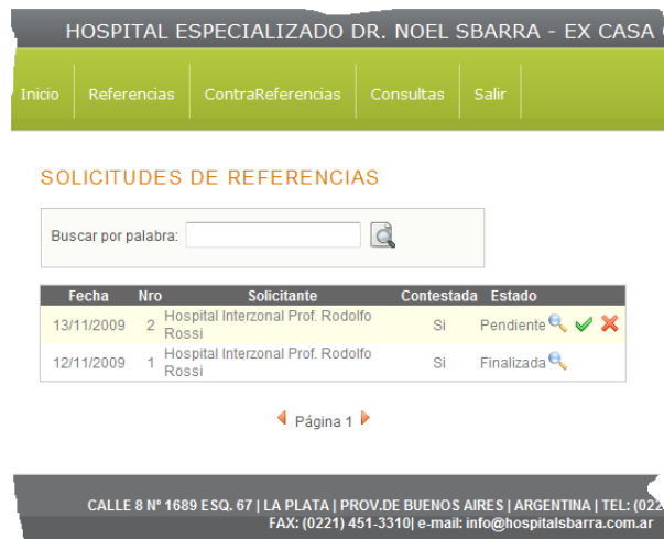
Figura 2: Lista de Referencias dirigidas a un Médico Interno