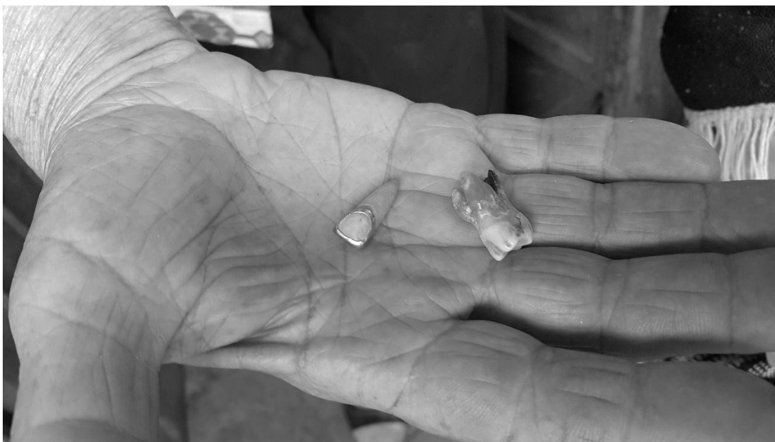
El diente frontal y una muela extraído de Eudoro Amarilla