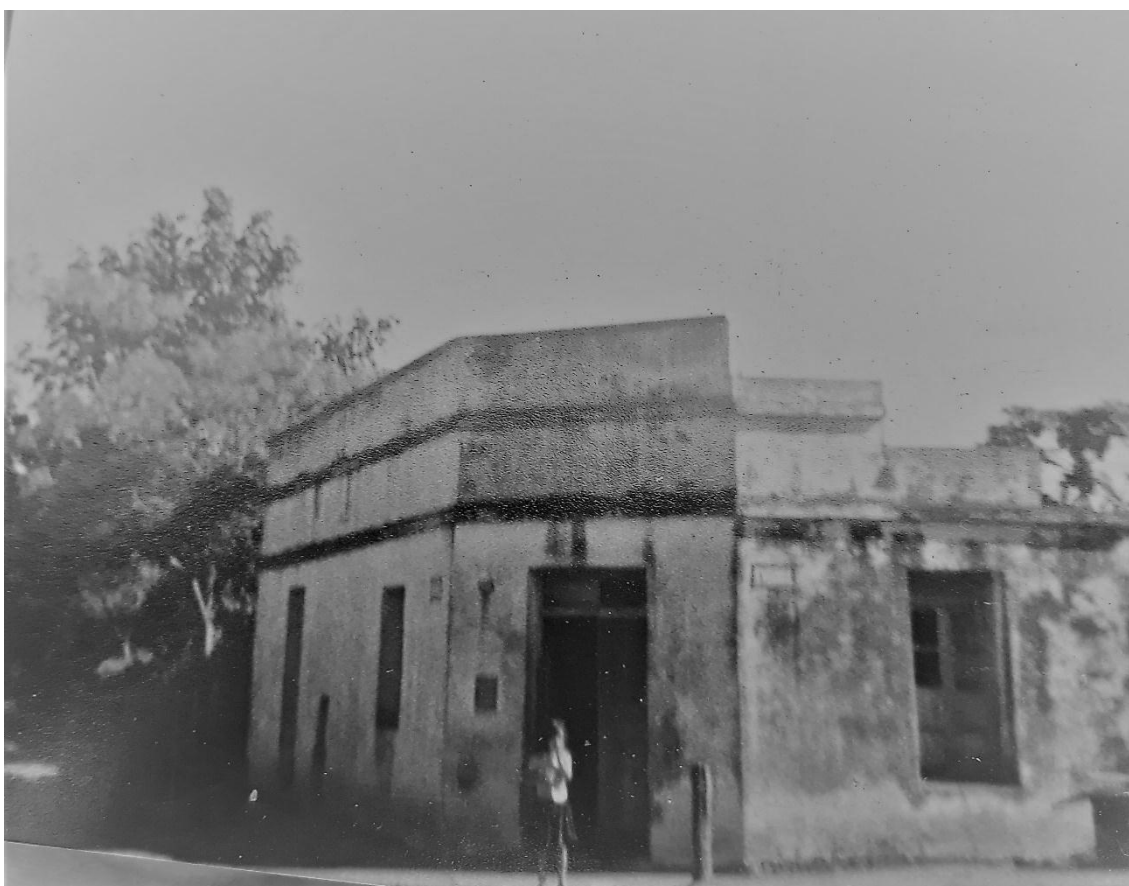
Fachada de la casa de la familia Ortellado. Se conserva hasta el momento.