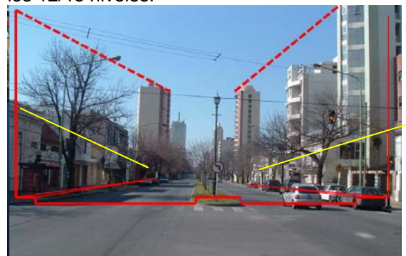
Fig.11 - Jerarquización de Avenida 44 e incremento de indicadores urbanísticos.

Se produjo un proceso de densificación, en el sector central del casco y en los barrios, a partir de la renovación urbana, provocada por la demolición de viviendas unifamiliares de antigua data, que fueron reemplazadas por edificios en altura multifamiliares en altura (Fig. 12).La altura máxima permitida es de 10 pisos, pero en la realidad se verifica que se han aplicado premios, superando algunas construcciones, los 12/13 niveles.