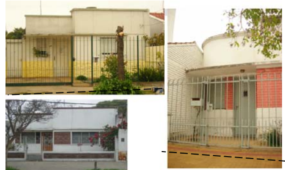
Fig. 7 - Vivienda Unifamiliar

Año 1957- División administrativa de los Partidos de Ensenada y Berisso: esta norma no regula específicamente el casco urbano de La Plata, pero tuvo consecuencias indirectas sobre su desarrollo.