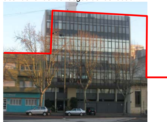
Fig. 8 – Edificio moderno en altura convive con vivienda unifamiliar fundacional.

Se produce un proceso explosivo de construcción en altura, renovación urbana y densificación del área centro, con predominio del edificio en altura, provocando el quiebre con el modelo fundacional, resultando un paisaje heterogéneo (Fig. 8) con pérdida de identidad en ese sector. Se consolidan los alineamientos comerciales por las calles 8 y 12. Aparición de tipologías características de las zonas suburbanas dentro del casco, con texturas, materiales, retiros que motivan abandono de los rasgos de identidad.