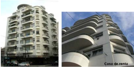
Fig. 5 - Arquitectura Moderna. Viviendas Multifamiliares