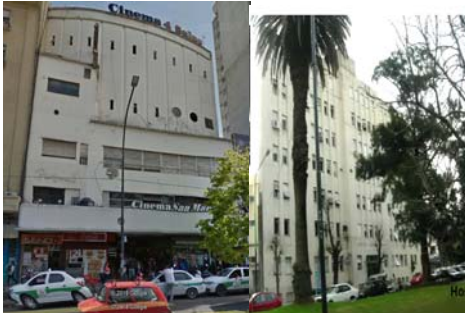
Fig. 6 - Arquitectura Moderna. Equipamiento ocio y salud.