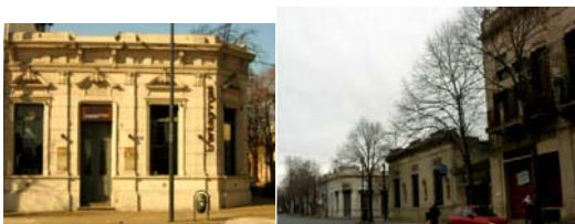
Fig. 3 - Arquitectura de Trama – vivienda particular

El “Código / norma Fundacional” plantea desde el aspecto morfológico, una relación biunívoca, proponiendo y regulando la implementación de trazados y alzados diferenciados entre la arquitectura de trama (Fig. 3) y la arquitectura institucional (Fig. 4).