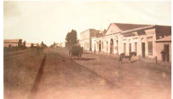
Fig. 3 - Arquitectura de trama