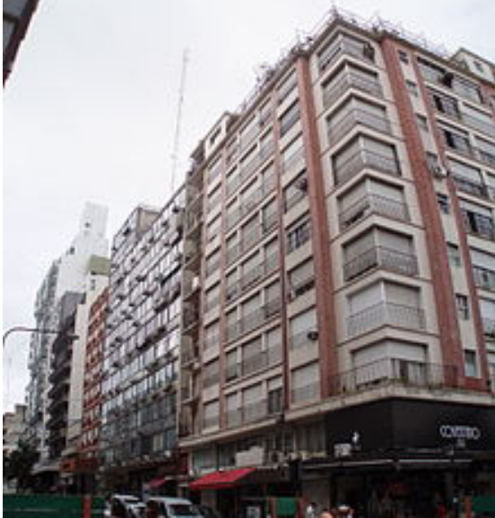
Fig. 9 – Grandes edificios multifamiliares en altura en el centro de la ciudad. Ruptura definitiva del modelo morfológico fundacional.

Provincial N° 8912/77 de Ordenamiento Territorial y Uso del Suelo de la provincia de Bs. As.