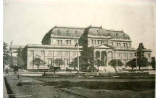
Fig. 4 - Arquitectura Institucional Edificios Públicos

Entre 1880 y 1914 se construyen los primeros edificios públicos, entidades bancarias, ministerios, edificios educativos, la estación de ferrocarril, viviendas particulares y casas de renta o inquilinato, desde 1914 hasta 1930, considerando algunos aspectos del contexto internacional, como los Impactos de la 1º Guerra Mundial, la Crisis mundial de 1920, se produce el completamiento de la trama urbana, con la presencia de edificios de vivienda multifamiliar y de equipamientos, en altura, cuya impronta morfológica se ve modificada por la influencia del Movimiento Moderno en la arquitectura (Fig. 5 y 6), que implicó un cambio sustantivo acerca del modo de habitar.