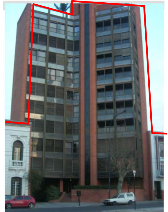
Fig. 10 - Arquitectura moderna versus arquitectura tradicional fundacional.

y en función de la localización relativa de los terrenos respecto a estos elementos, se ampliaron las posibilidades constructivas (altura y densidad).