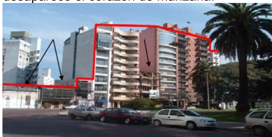
Fig. 12 – Transformaciones morfológicas de la ciudad. Año 2010 - Ordenanza N° 10703/10

Incrementa los indicadores urbanísticos de la norma anterior. En el casco fundacional, sobre las avenidas y zonas más céntricas, se incrementan el Factor de ocupación del suelo y la densidad. En las áreas menos céntricas, estos indicadores disminuyen. La ciudad crece por densificación y verticalización y desaparece el corazón de manzana.