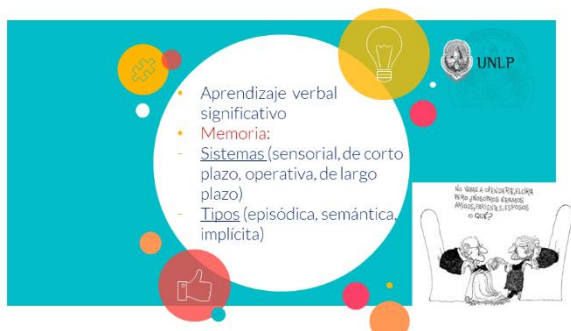
Figura 2. Humor Metacognitivo