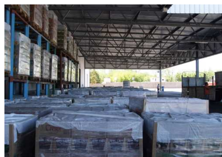
Tabla 3. Características dimensionales y de materialidad de la Bodega Santa Ana