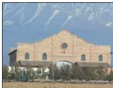
Tabla 1. Características dimensionales y de materialidad de la Bodega Perdices