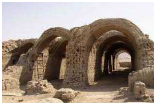
Figura 2. Bodegas de Rameses II en Tebas, Egipto.

Podemos afirmar entonces que las bodegas primitivas eran cuevas encontradas o excavadas en la tierra, o espacios especiales construidos a dicho fin con materiales con alta inercia térmica como piedras, tierra o adobe. Ambas soluciones presentaban una estructura completa de resistencia térmica y por lo tanto mucha estabilidad en las temperaturas interiores necesaria especialmente para la elaboración del vino.