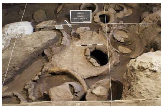
Figura 1. Sitio arqueológico en Areni, Armenia.

Sobre las mejores condiciones de preservar el vino, desde la edad Antigua, se conoce la sensibilidad del vino a la temperatura, por lo que se construyeron construcciones protegidas del sol. En otros casos, gruesos bloques de tierra fueron usados en depósitos, como es el caso de las bodegas de Rameses II en Tebas. (Yravedra Soriano, 2003) (Figura 2). Sabemos que los recipientes [conteniendo vino] se ubicaban en depósitos frescos y oscuros. (Ruiz Mata, 1995).