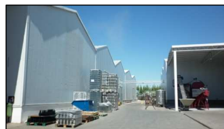
Tabla 4. Características dimensionales y de materialidad de la Bodega Zuccardi