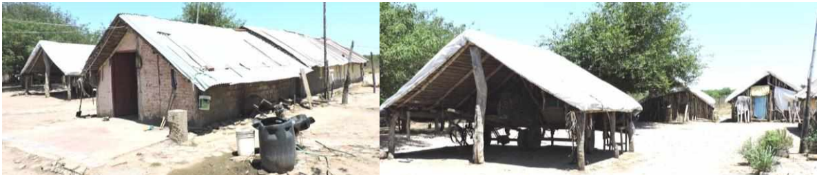
Figura 4: Viviendas y construcciones exteriores, Villa María

Las técnicas constructivas y materiales adoptados para la construcción de las viviendas, evidencia la pérdida de manejo de tecnologías propias o características del lugar (barro y paja) que son reemplazadas por otras como el uso de bloques de suelo cemento o ladrillo.