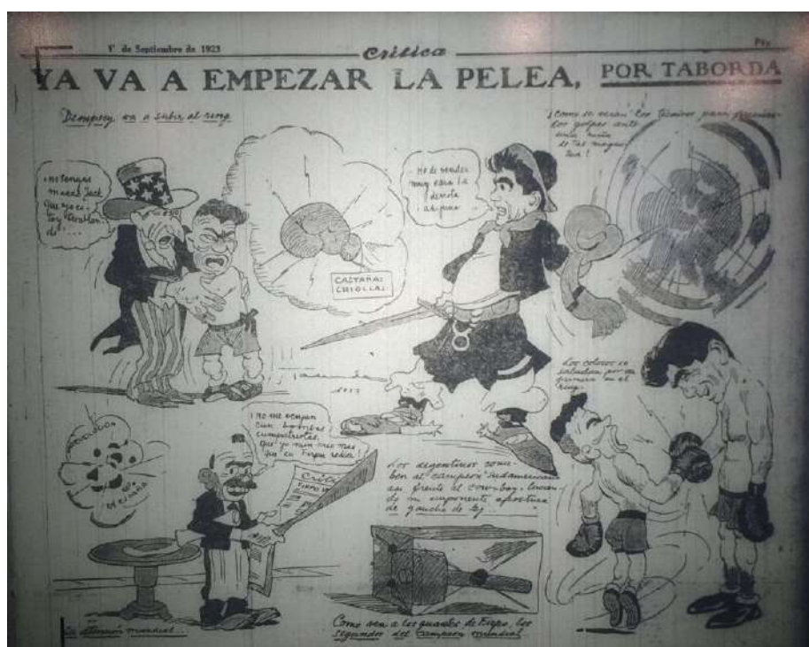
Imagen 7. Crítica [Buenos Aires], set. 14, 1923: 5

Por otro lado, el Tío Sam y Jack Dempsey están aterrizados por la fuerza de las castañas criollas y la brutalidad del coloso de Firpo. A su vez, esta caricatura refleja la importancia que los medios de comunicación locales le daban a la pelea de boxeo, ya que intentaban transmitir que toda la atención del mundo estaba puesta en este evento deportivo, dejando de lado cualquier otro tipo de acontecimiento, hasta la revolución española que se estaba llevando a cabo en el continente europeo.