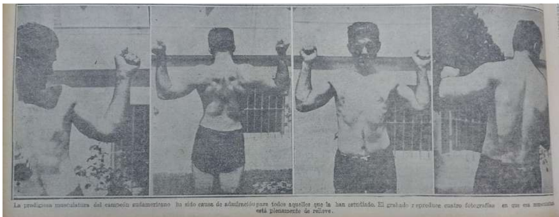
Imagen 4. La Época [Buenos Aires], set. 14, 1923: 20 12

hombres que poblaban la Argentina. En este sentido, Mosse (1998) plantea que la construcción de la masculinidad moderna depende de la relación entre alma, cuerpo, moralidad y estructura corporal, una relación que pretende ser natural para volverse estándar de la normalidad, procurando construir patrones normativos de moralidad y comportamiento. Así, la masculinidad tiene que ser cultivada y desarrollada con constancia, implica un cultivo corporal y moral a través de distintos hábitos y conductas socialmente establecidas como sanas y masculinas . Uno de los vehículos más utilizados y eficaces para instalar como hegemónicas ciertas masculinidades, y como saludables en términos físicos, intelectuales y morales ciertas conductas, fueron las prácticas deportivas. A lo largo del siglo XX, principalmente en sus comienzos, los deportes estuvieron bajo la legitimidad de las ciencias médicas y fisiológicas, convirtiéndose así en un bien necesario para el mejoramiento y desarrollo de las aptitudes físicas, intelectuales y morales de los cuerpos individuales y poblacionales.