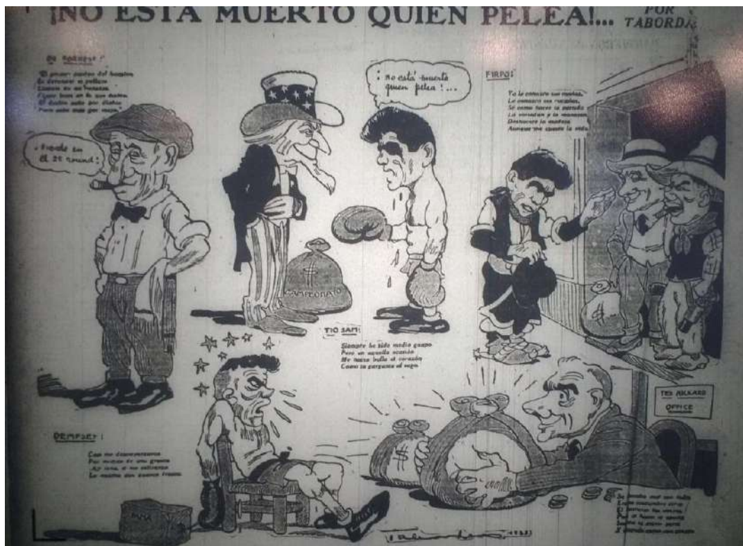
Imagen 8. Crítica [Buenos Aires], set. 15, 1923: 2

también fue reflejado en las caricaturas «No está muerto quien pelea» (Imagen 8), «¿Ha sido una pelea o un asesinato alevoso?», 32 «¡No hay plazo que no se cumpla!», 33 entre otras más.