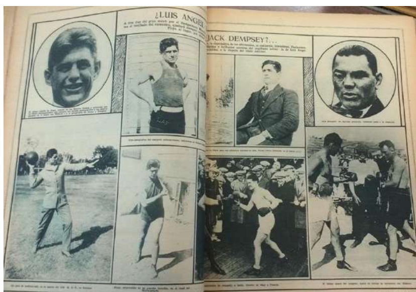
Imagen 2. Fray Mocho [Buenos Aires], set. 11, 1923: 594, Carlos Correa Luna

Otro de los aspectos analizados es la incesante intención de transmitir la vida del ídolo nacional en su estadía en los Estados Unidos. Había una necesidad por transmitirlo todo. Sus entrenamientos, descansos, salidas, paseos, comidas, visitas, compañías femeninas, amigos y también sus estados de ánimo. Todo debía ser informado, narrado, comentado y mostrado por la prensa escrita.