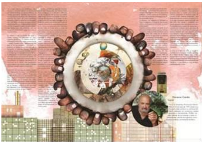
TF Estética 2012 "CARDO el narrador", de Giovannone, Mastroleo y Magrinelli. Revista 2013 OXIMORON por Rizzo /Dumigan