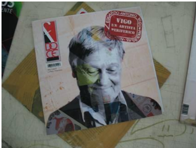
TF Estética 2011 "VIGO un artista periférico", de Loreto y Puzzo. Revista 2012