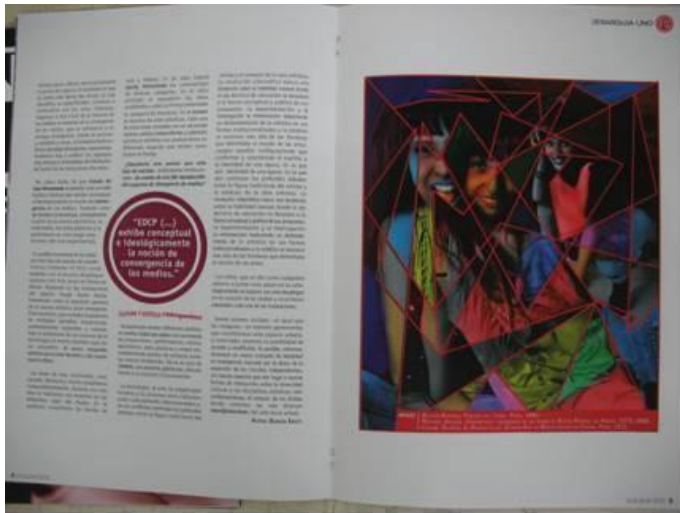
TF Estética 2011 “CAOS PERMANENTE” de Damian Erviti. Revista 2012