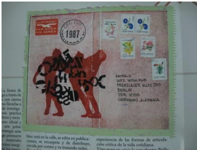
TF Estética 2011 “VIGO un artista periférico” de Loreto y Puzzo. Revista 2012