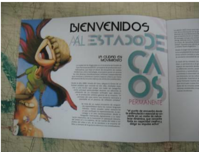
TF Estética 2011 "CAOS PERMANENTE" de Damián Erviti. Revista 2012