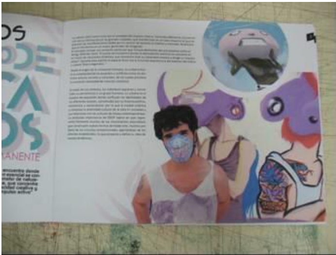
TF Estética 2011 "CAOS PERMANENTE", de Damian Erviti. Revista DCV Taller B 2012