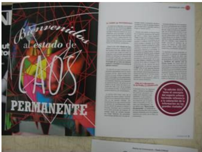
TF Estética 2011 "CAOS PERMANENTE", de Damian Erviti. Revista 2012