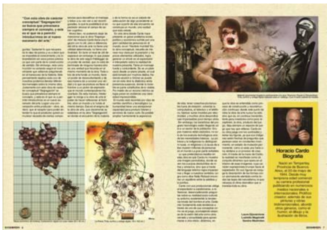
TF Estética 2012 "CARDO el narrador", de Giovannone, Mastroleo y Magrinelli. Revista 2013 OXIMORON por Rizzo /Dumigan