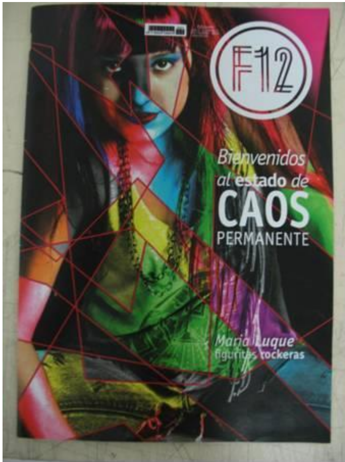
TF Estética 2011 "CAOS PERMANENTE" de Damián Erviti. Revista 2012