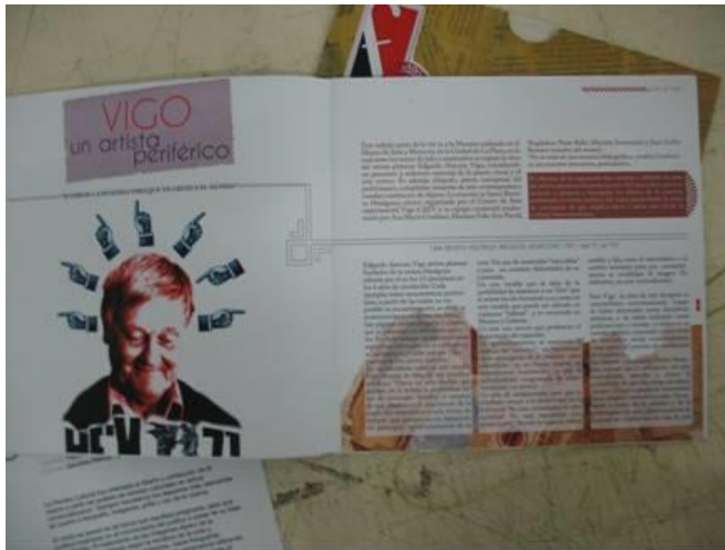
TF Estética 2011 "VIGO un artista periférico" de Loreto y Puzzo. Revista 2012