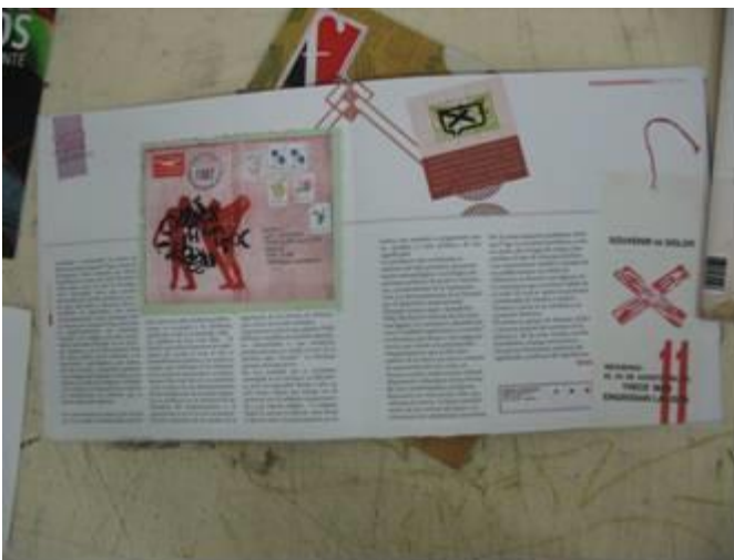
TF Estética 2011 “VIGO un artista periférico” de Loreto y Puzzo. Revista 2012