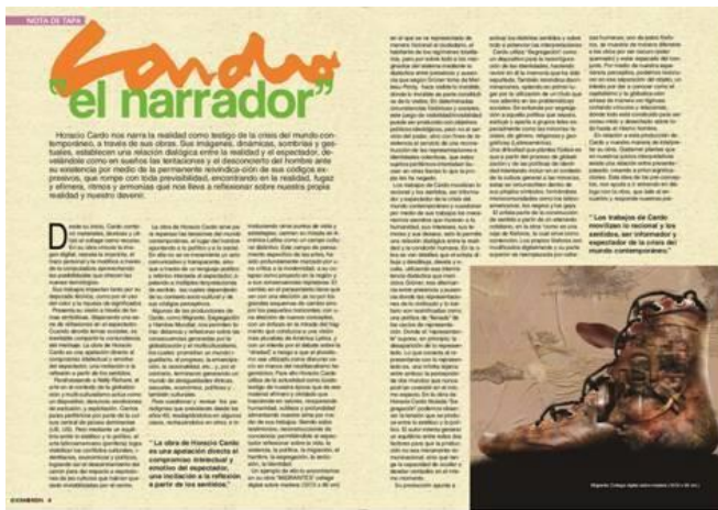
TF Estética 2012 "CARDO el narrador", de Giovannone, Mastroleo y Magrinelli. Revista 2013 OXIMORON por Rizzo /Dumigan