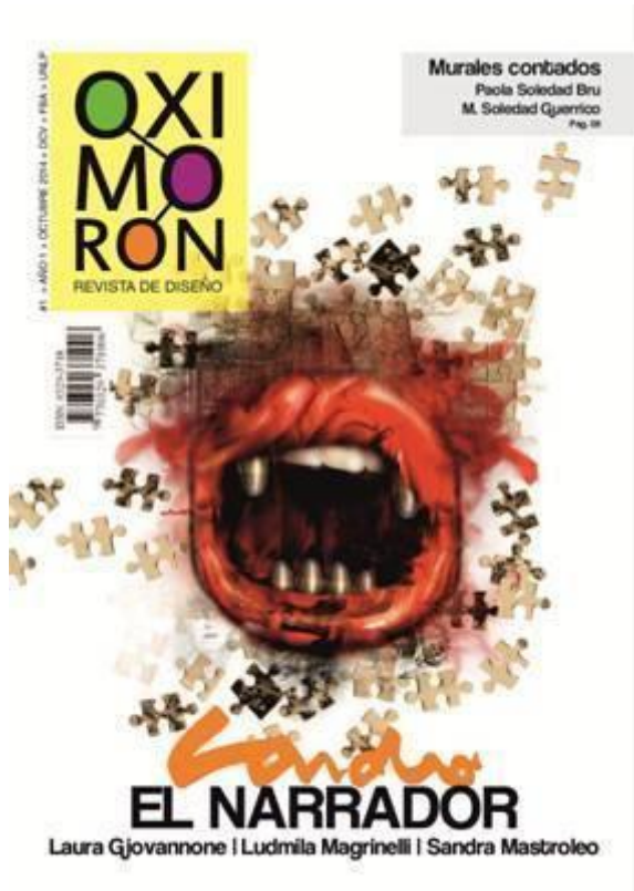
TF Estética 2012 "CARDO el narrador", de Giovannone, Mastroleo y Magrinelli. Revista 2013 OXIMORON por Rizzo /Dumigan