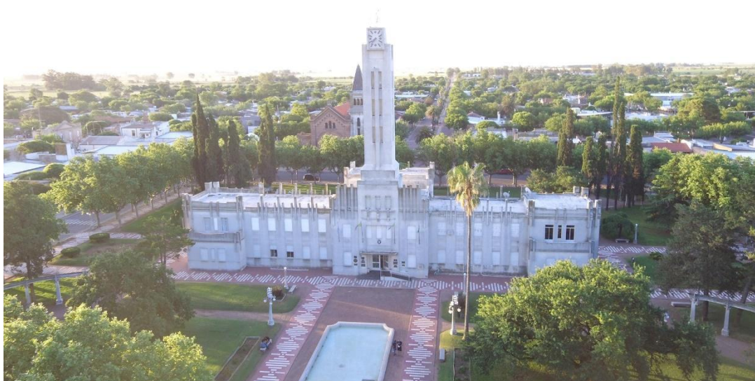
Palacio Municipal

Pellegrini es la cabecera del partido homónimo y está ubicado al oeste de la provincia de Buenos Aires, en el límite con La Pampa, más precisamente en el kilómetro 496 de la Ruta Nacional N° 5. De acuerdo al último censo y estimaciones, tiene casi 7000 habitantes. Entre sus atractivos, suele ser visitada por viajeros que recorren el circuito de obras de Francisco Salamone, el reconocido arquitecto italo-argentino, quien dejó su huella en distintos puntos de la provincia de Buenos Aires en la década de los treinta y los cuarenta.