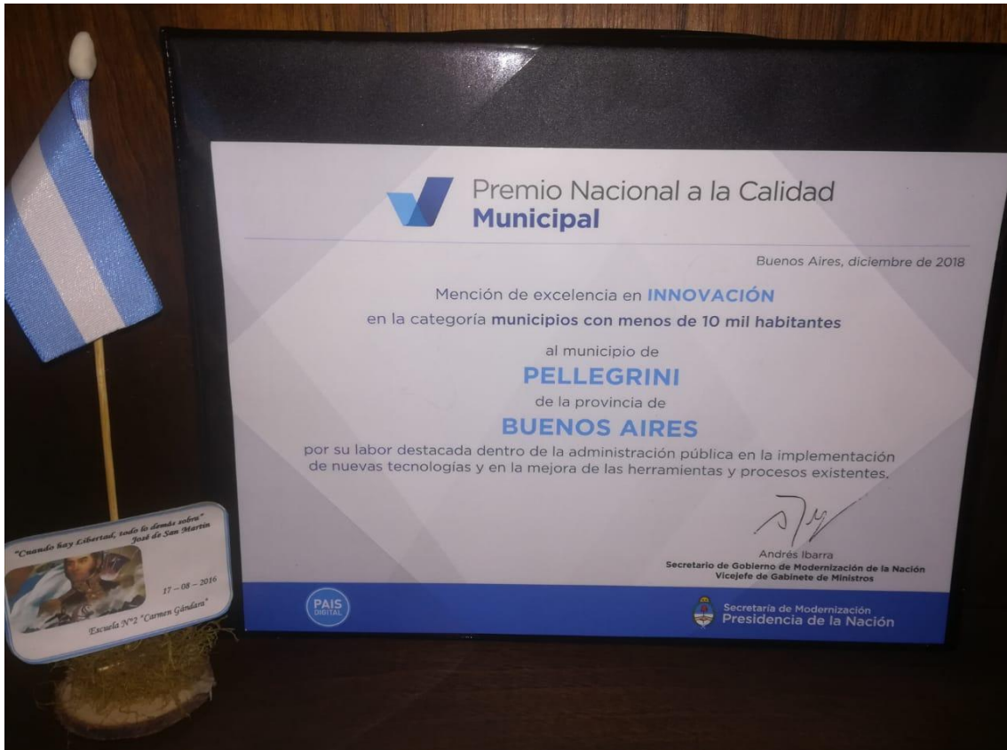
La distinción en Innovación en la categoría de municipios con menos de 10 mil habitantes.