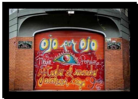
Fotografía 4: Mural ubicado hasta 2018 en Av. Garay y Av. Jujuy; Fotografía 5: grafiti en Monteagudo al 300. Fotografía 6: grafiti en puesto de diarios en Av. Caseros y Deán Funes; Fotografía 7: grafiti Av. Brasil y Catamarca.

Por otra parte, en la esquina de Grito de Asencio y Elía, El Centro Murga Pasión Quemera, una de las murgas con más trayectoria en el barrio, pintó uno de los murales más grandes, que todavía permanece, y que ha sido renovado en diferentes ocasiones. (Fotografías 8 y 9).