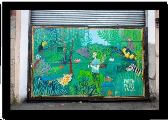
Fotografía 10: Av. Brasil entre Esteban de Luca y Dean Funes,