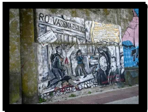
Fotografías 12, 13, 14 y 15.

Luego de relevar la diversidad de intervenciones de arte público que encontré en el interior del perímetro del barrio de Parque Patricios, comencé a contactar a las y los autores de estas expresiones artísticas. El trabajo etnográfico realizado incluyó el relevamiento de las obras, la realización de entrevistas tanto con grabador de audio como en formato filmico y técnicas de observación participante. Utilizando estas herramientas de investigación me propuse visibilizar y poner en valor estas expresiones de arte público presentes en el barrio. Así el proyecto incluyó la realización de tres tipos de producciones diferenciales.