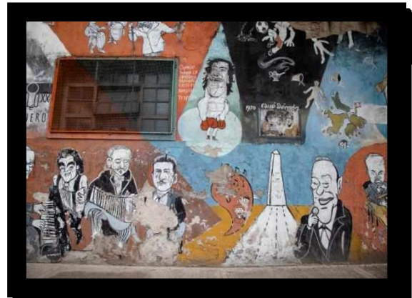
Fotografías 8 y 9.

Asimismo, el grupo de teatro comunitario “Los Pompapetriyazos” realizó una serie de murales como parte de un taller denominado “Proyecto museo a cielo abierto” que conllevó la intervención de las paredes y persianas (Fotografías 10 y 11).