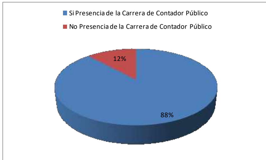
Gráfico N° 1: Presencia de la carrera de contador público en Universidades Privadas de Argentina.

De las búsquedas y análisis realizados sobre una muestra representativa del 91,30% y conformada por las cuarenta y dos (42) primeras de las 46 Universidades Privadas de Argentina, según Universico (s. f.) a agosto 2021, resulta que: La carrera de Contador Público (C. P.) se imparte a octubre de 2021, ya sea de manera virtual y/o con presencialidad física, en 37 Universidades, representado poco más del 88% del total de Universidades Privadas de Argentina a dicha fecha