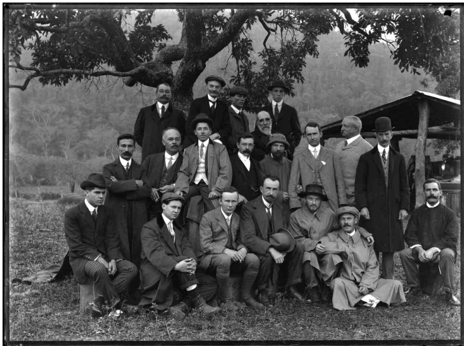
FIGURA 1: Uma das versões da fotografia feita com as equipes que estavam em Passa Quatro - 1912.

Apesar de todos os esforços realizados para que as equipes viessem realizar seus trabalhos no Brasil os resultados astronômicos, por assim dizer, do eclipse de 10 de outubro de 1912 foram inexistentes. As condições meteorológicas e, em especial, as chuvas na Cidade de Passa Quatro onde estava reunida a maioria das equipes, impediu que os resultados fossem bons. Um desastre que não estava nas mãos de