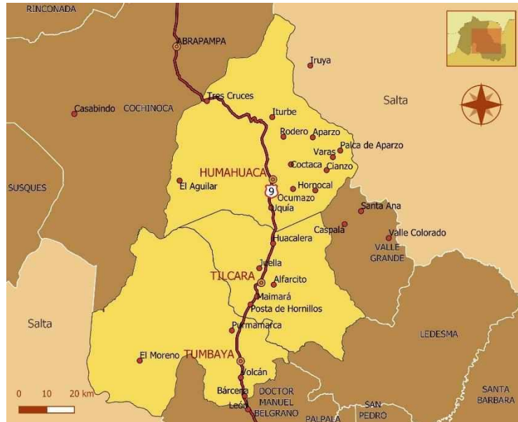
Figura 2: Quebrada de Humahuaca, departamentos y localidades.