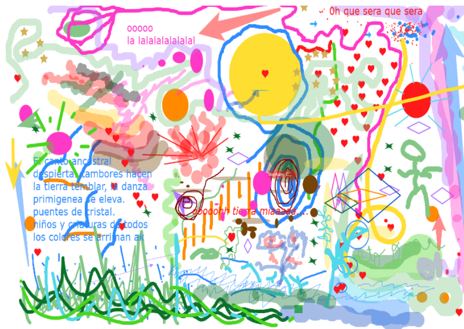
FIGURA 2 Composición gráfica digital

Una compañera ingresa tarde y se encuentra con una pizarra llena de trazos, formas, colores. Escucha mujeres improvisando vocalmente, observa y escribe en el cuadro “Oh Qué será, ¿qué será?” Esa pregunta se incorpora a la improvisación sonora y se va deslizando en melodías,