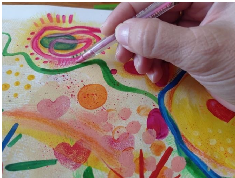
FIGURA 4 Revitalizando la obra

En la figura 4 observamos un fragmento del cuadro pintado por una de las participantes de la mateada, artista plástica, quien recibió la imagen digital (figura 2) y le incorporó una marca personal a modo de regalo para la siguiente mateada.